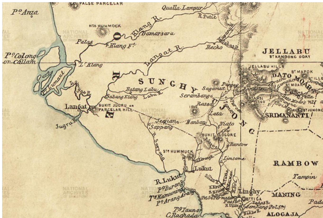
Peta sempadan Selangor-Sungai Ujong, 1876. Ketika itu kawasan Rekoh (Recko), termasuk Semenyih, Beranang, dan Ulu Langat, masih di bawah pengaruh Sungei Ujong, manakala Lukut di bawah Selangor: "compiled from sketch surveys made by Captain Innes R E, J W Birch and D Daly, and Admiralty Charts. Lithographed under the direction of Lt. Col. R. Home C.B.R.E" (Royal Geographical Society, London; Royal Geographical Society (Great Britain), 1876:

Semenyih, Beranang, Rekoh, dan Ulu Langat - di dalam Sungai Ujong.