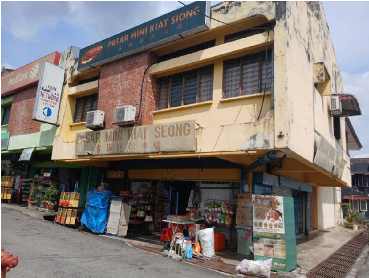
Pasar Mini Kiat Seong kini, di lot tepi Jalan 1/4A, Seksyen 1 BBB