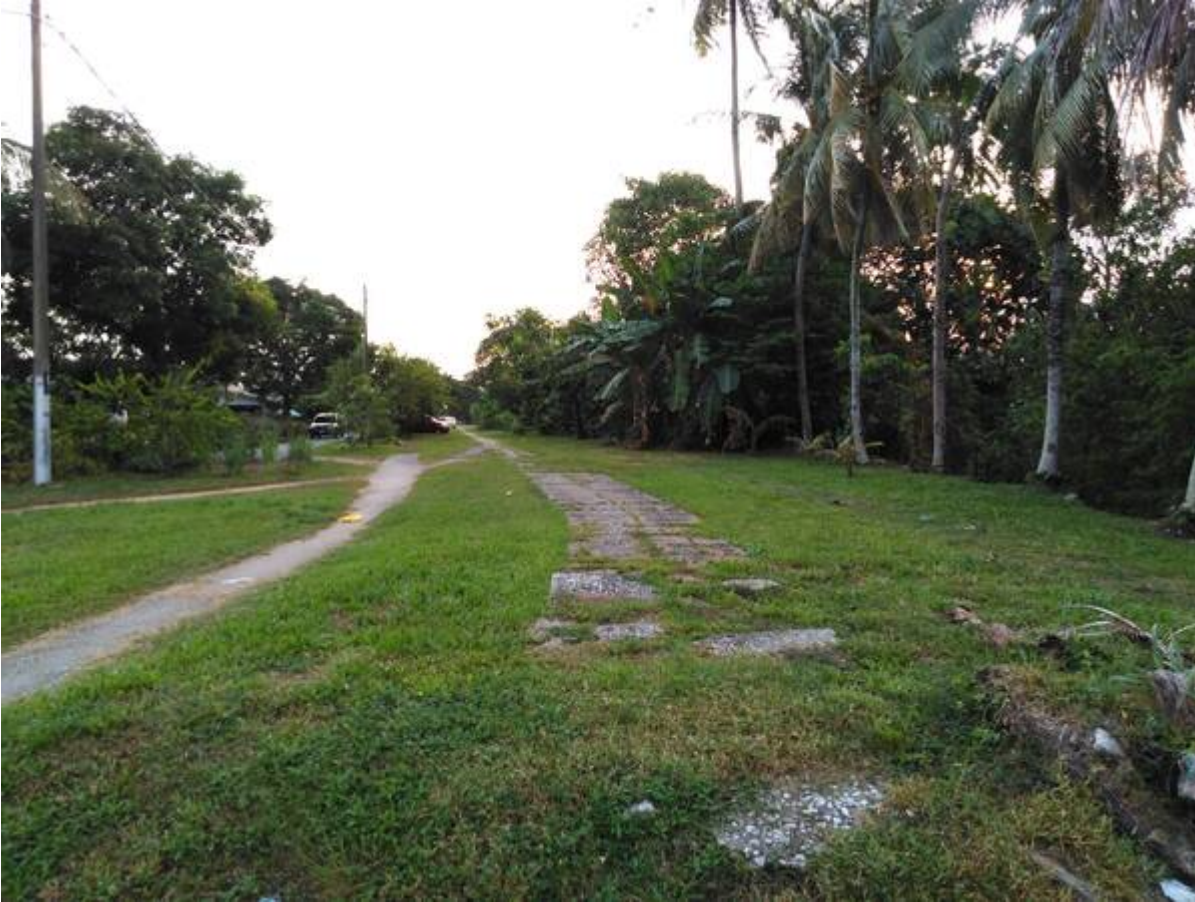
Di Fasa 1 (di depan pasar, 13 Ogos 2021).