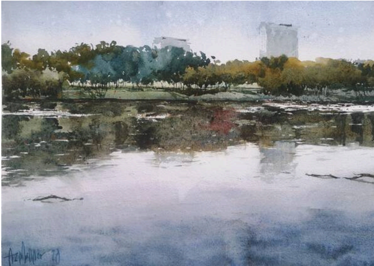
"Reflection (Taman Tasik Cempaka): Watercolor on Khadi paper, 30cm x 42cm" (Azmannor, 2020: "Reflection (Taman Tasik Cempaka)").