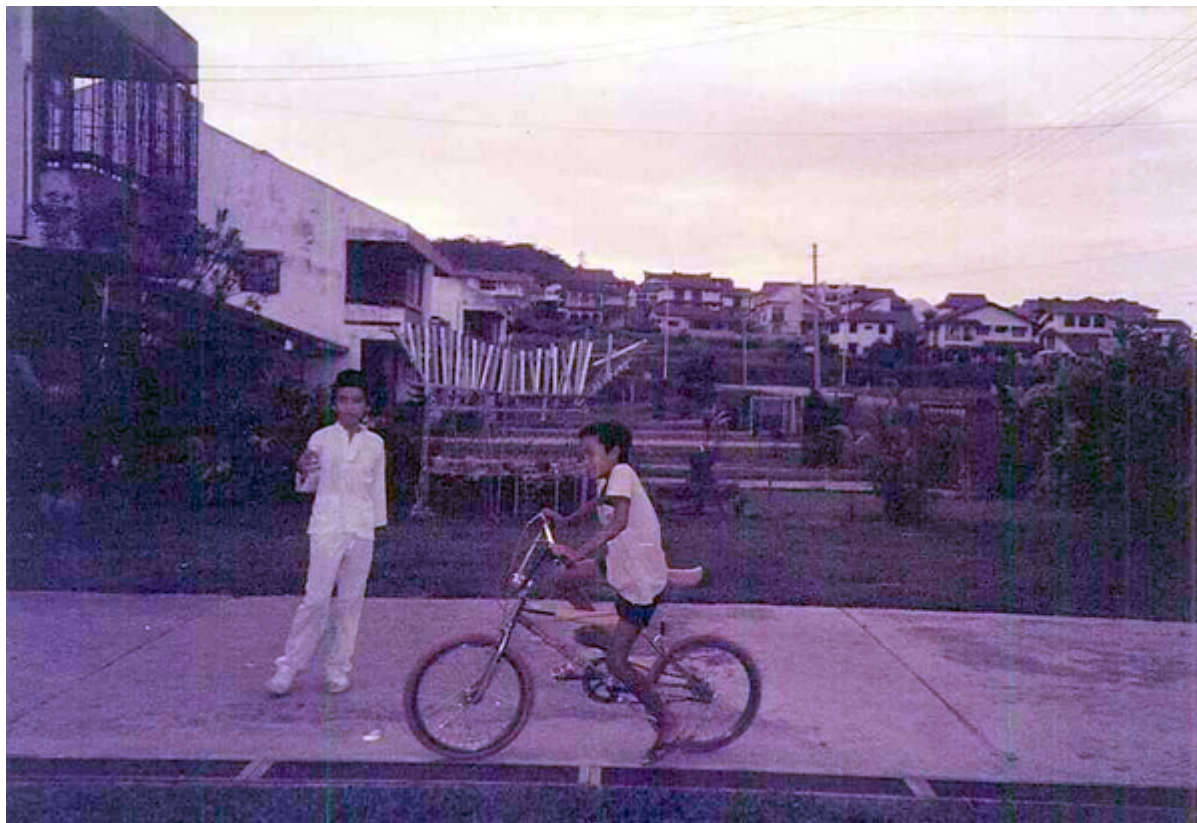
(Gambar: Faisal Zulhumadi @ Facebook, 2014 )