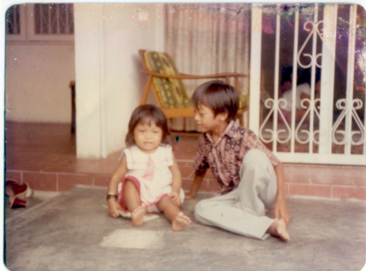
Di rumah Jalan 1/3C (1981-1983) (, sekitar 1981-1983).