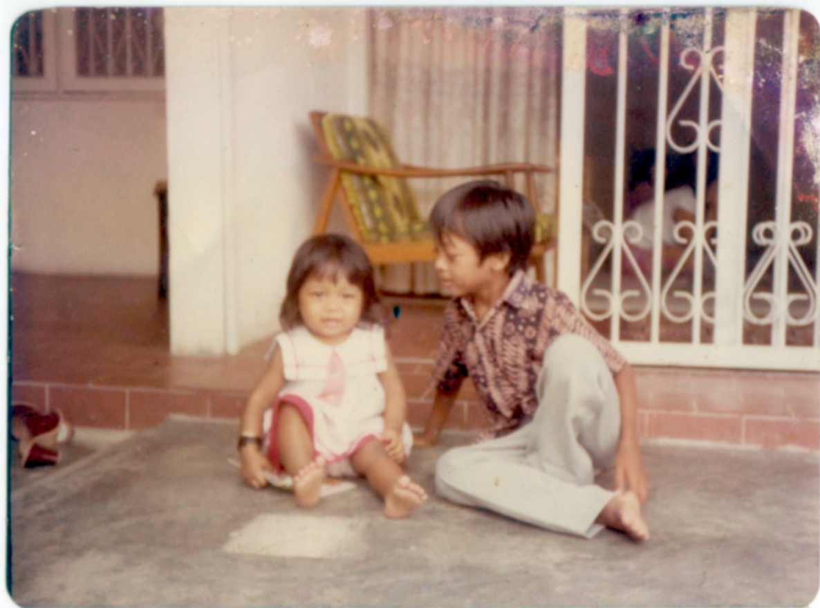
Di rumah Jalan 1/3C (1981-1983).