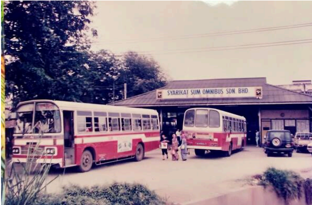
"Stesyen bas Sum Kajang ,foto sekitar tahun 1986 ." (Mustafa bin Yahya (Tapa Seni Rimba) @ Facebook Bandar Kajang Group, 19 April 2019: " Stesyen bas Sum Kajang ,foto sekitar tahun 1986 ").