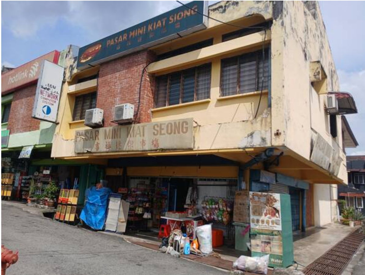
Pasar Mini Kiat Seong kini, di lot tepi Jalan 1/4A, Seksyen 1 BBB