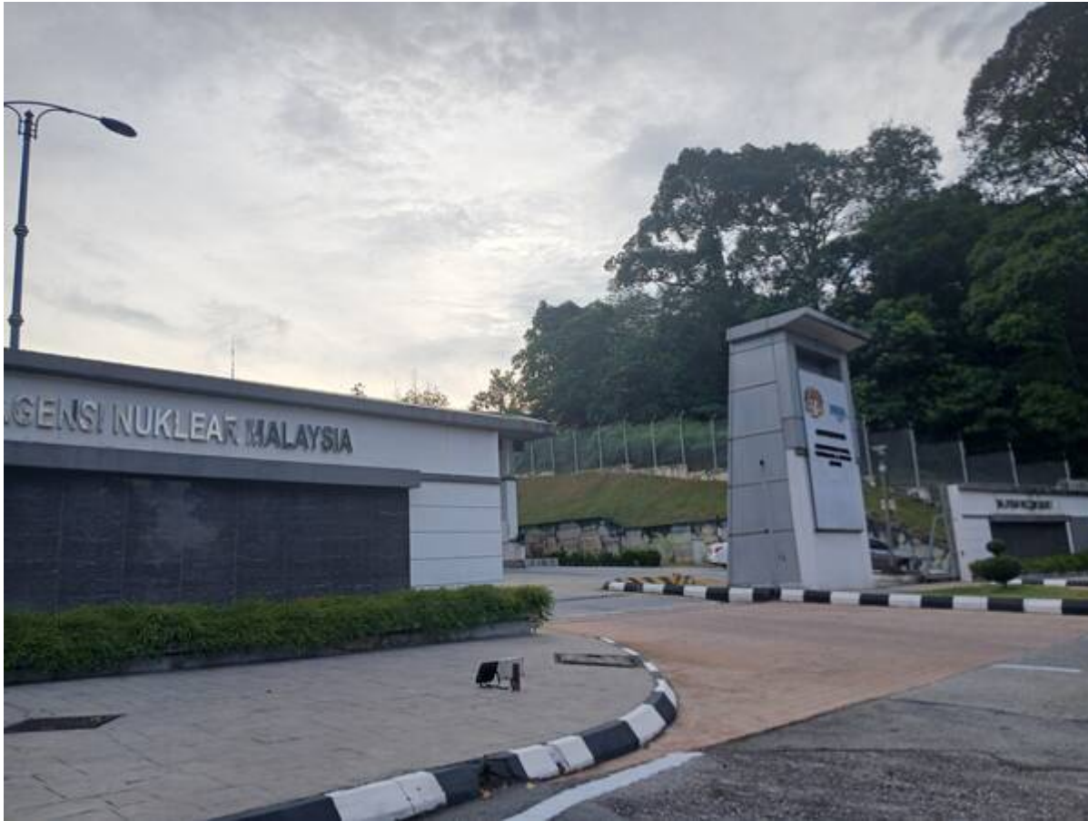
Agensi Nuklear Malaysia kini (Gambar: Sazli Shahrir, 2025).