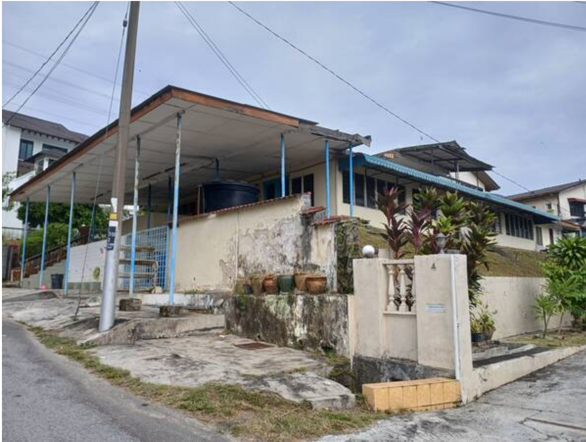
Surau Al-Umm (kini).