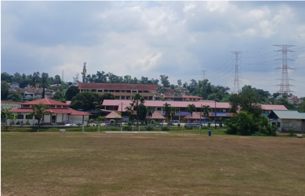
(Gambar: Sazli Shahrir, 2025).