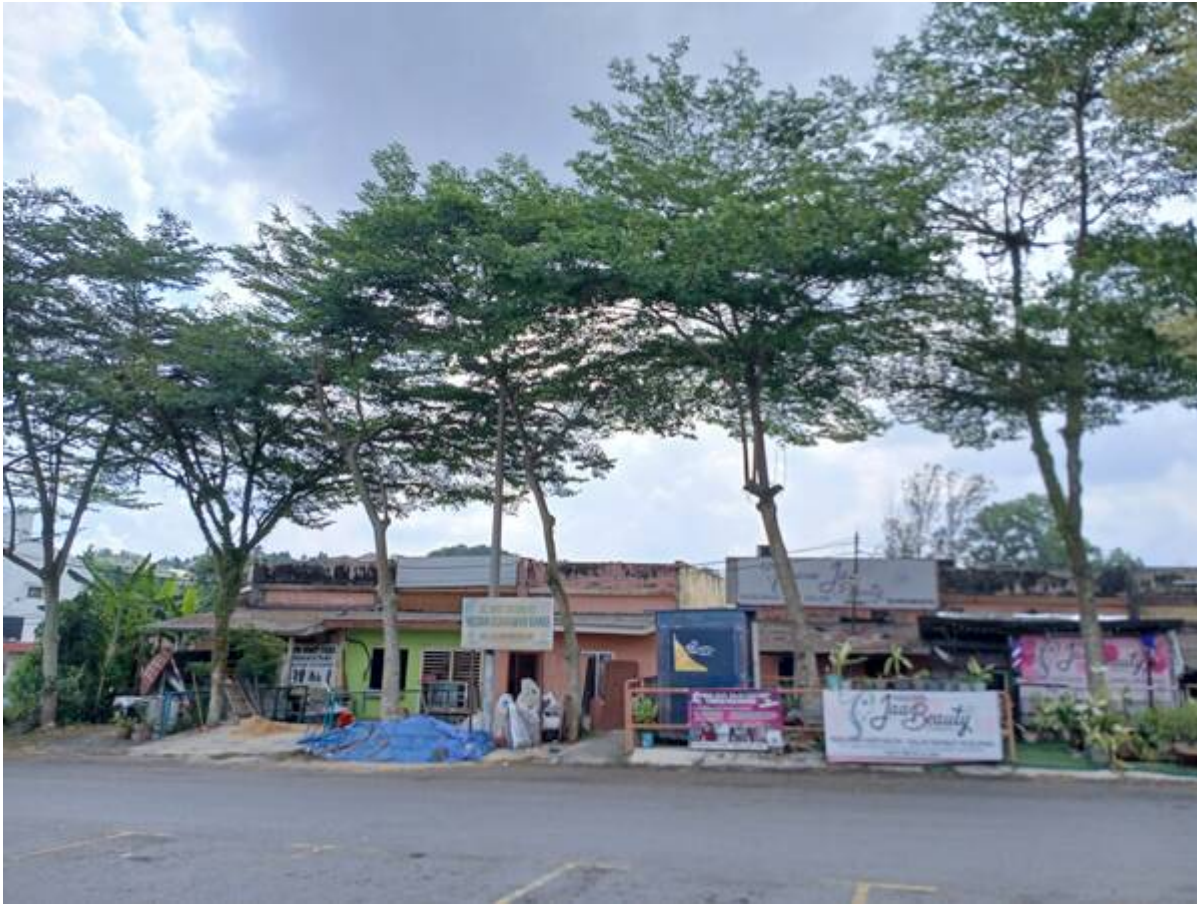
Medan Usahawan Bangi.

1980-an: Tapak pasar malam. Beli tauhu sumbat dan asam buah cermai.