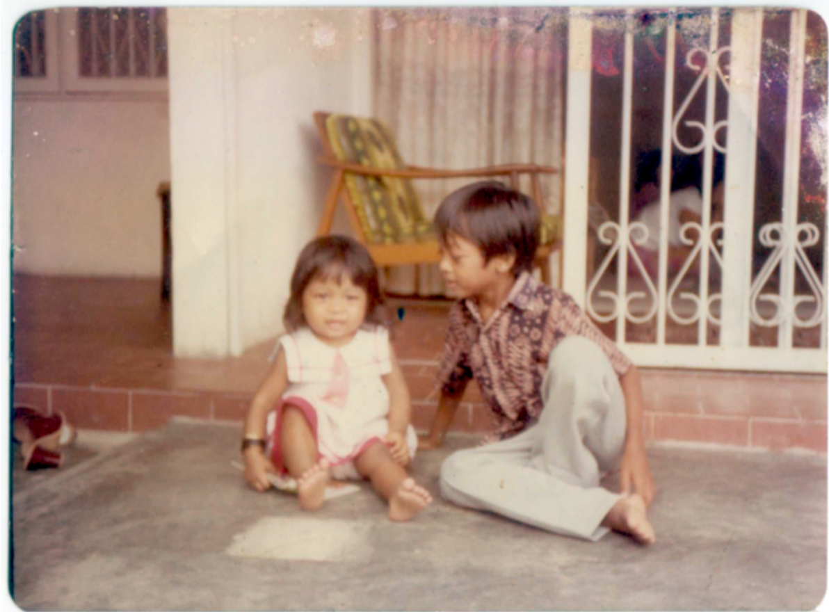
Di rumah Jalan 1/3C (1981-1983).