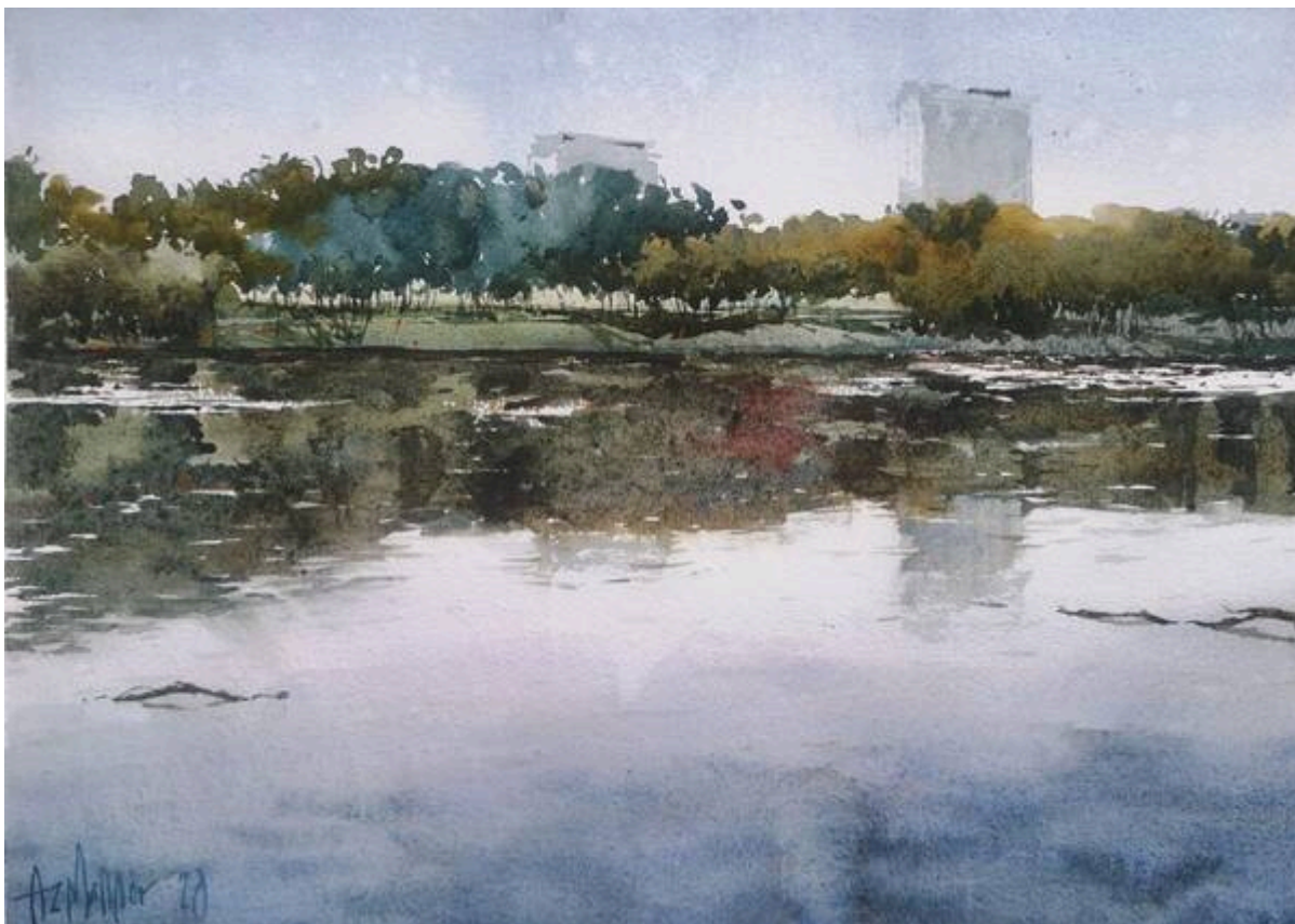
"Reflection (Taman Tasik Cempaka): Watercolor on Khadi paper, 30cm x 42cm" (Azmannor, 2020: "Reflection (Taman Tasik Cempaka)").