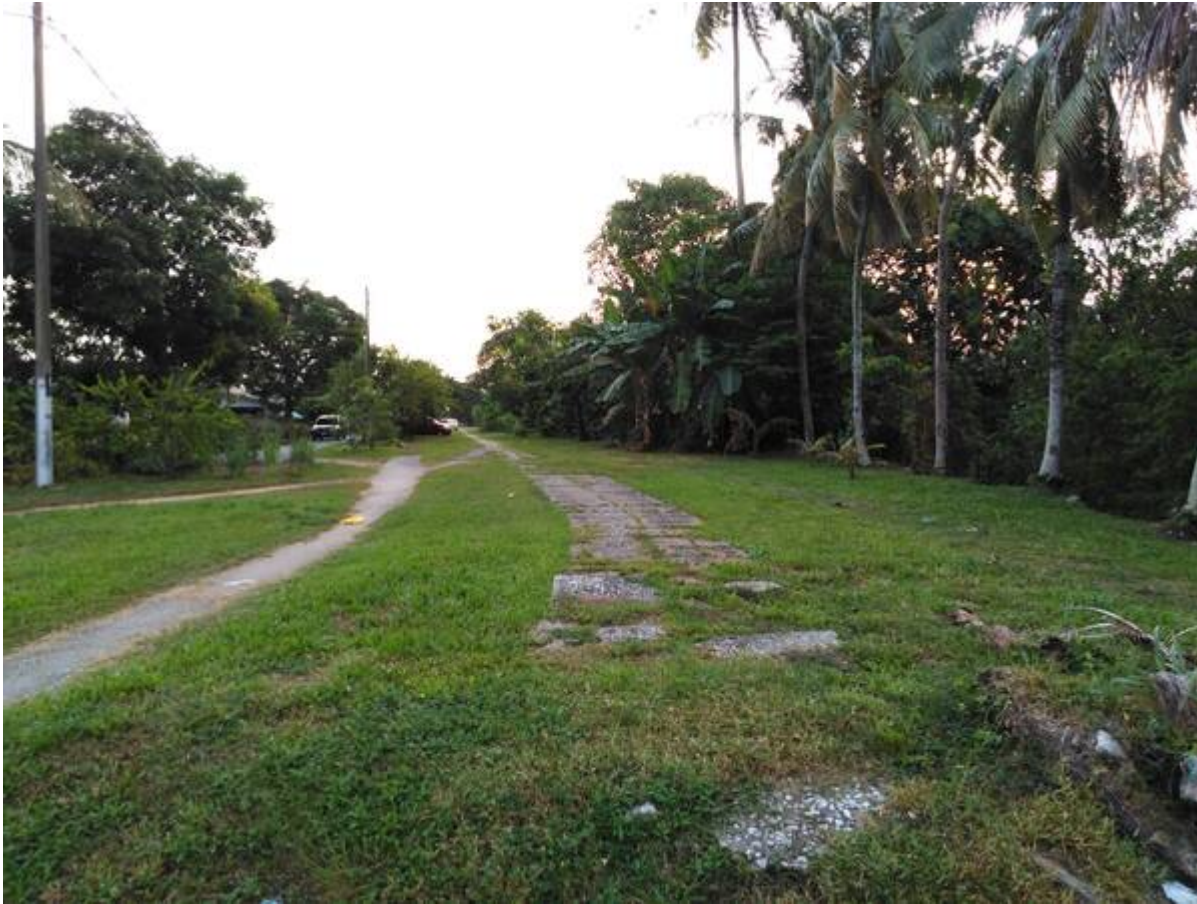
Di Fasa 1 (di depan pasar, 13 Ogos 2021).