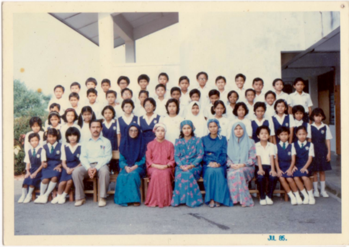
Darjah 5 Putih, SRK BBB (SK Jalan 2 kini), 1985