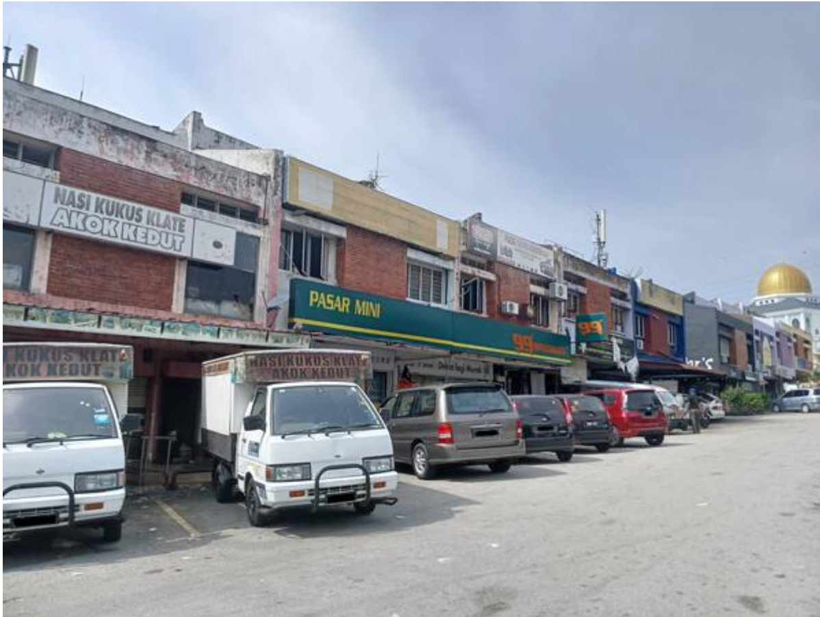
No. 4, Jalan 1/4 (99 Speedmart).