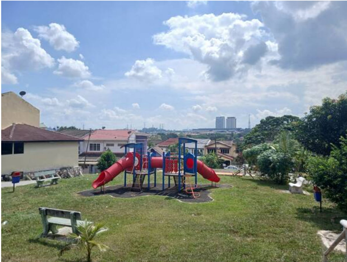
Taman permainan Jalan 1/3C (kemudian?) (Gambar: Sazli Shahrir, 2025).

Pemandangan dari taman permainan Jalan 1/3C ke arah barat laut