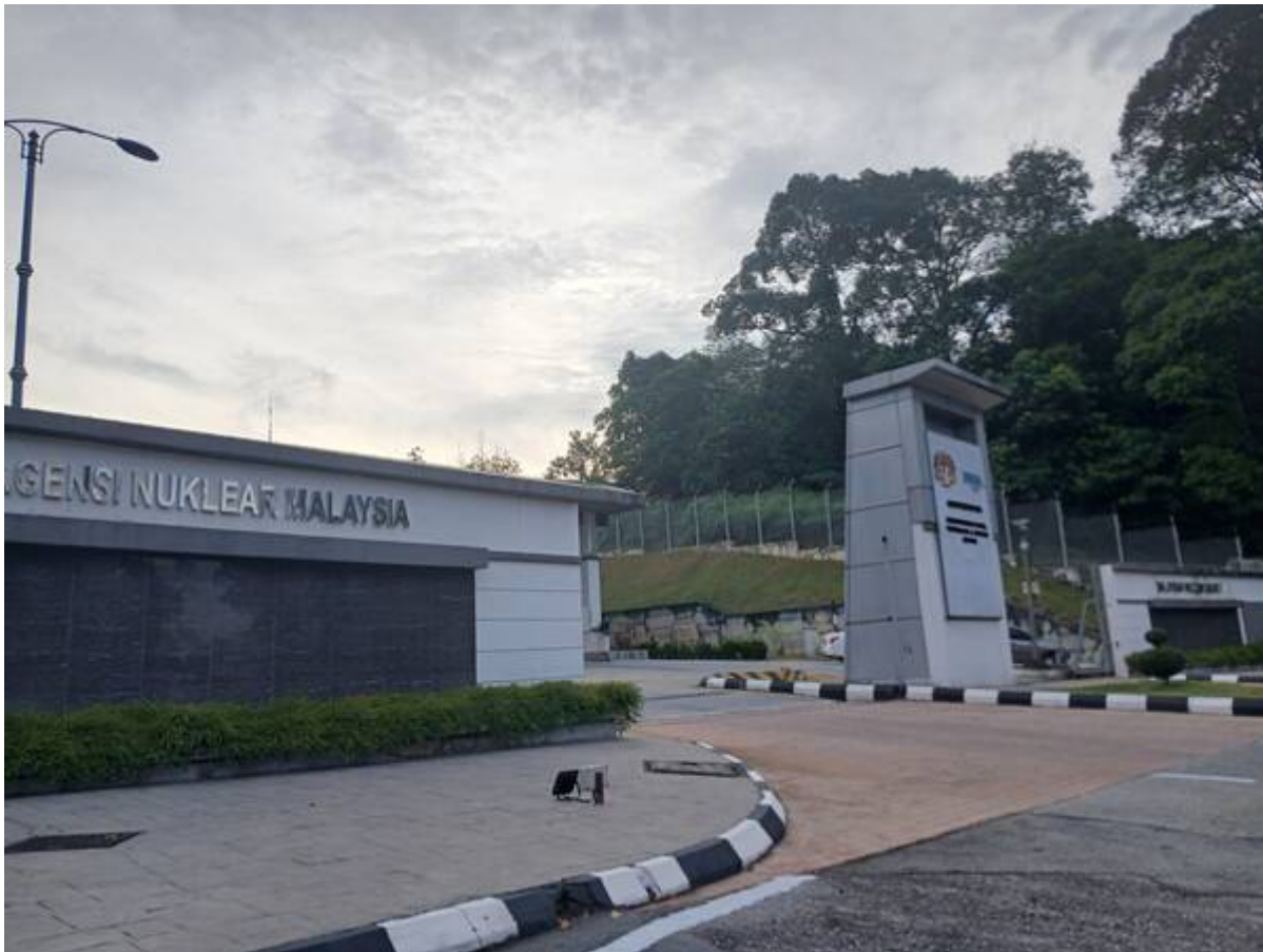
Agensi Nuklear Malaysia kini.