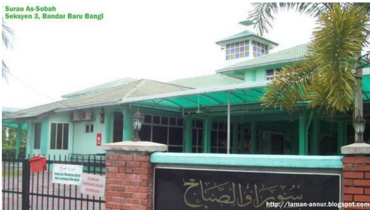
Bangunan surau As-Sobah yang asal (Persatuan Penduduk Bandar Baru Bangi, March 13, 2009: