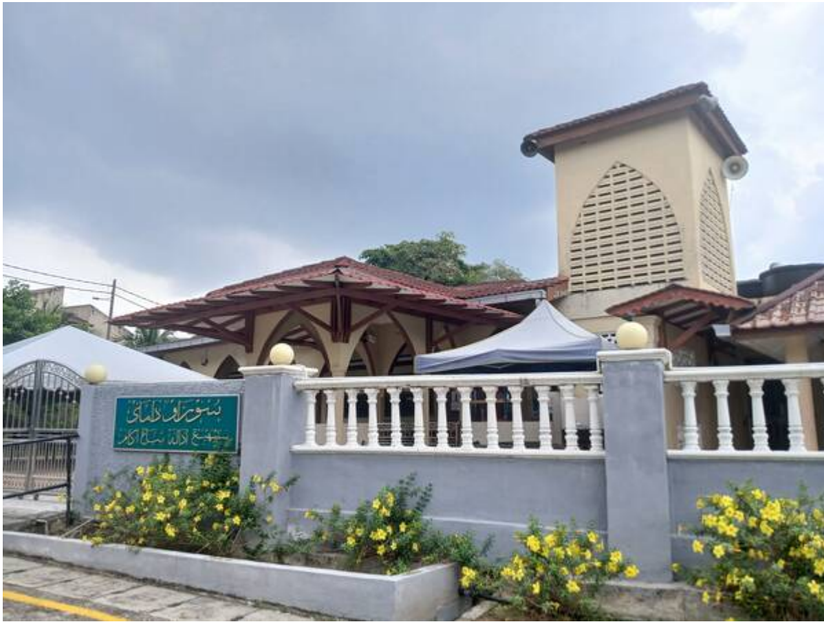
Surau Damai kini