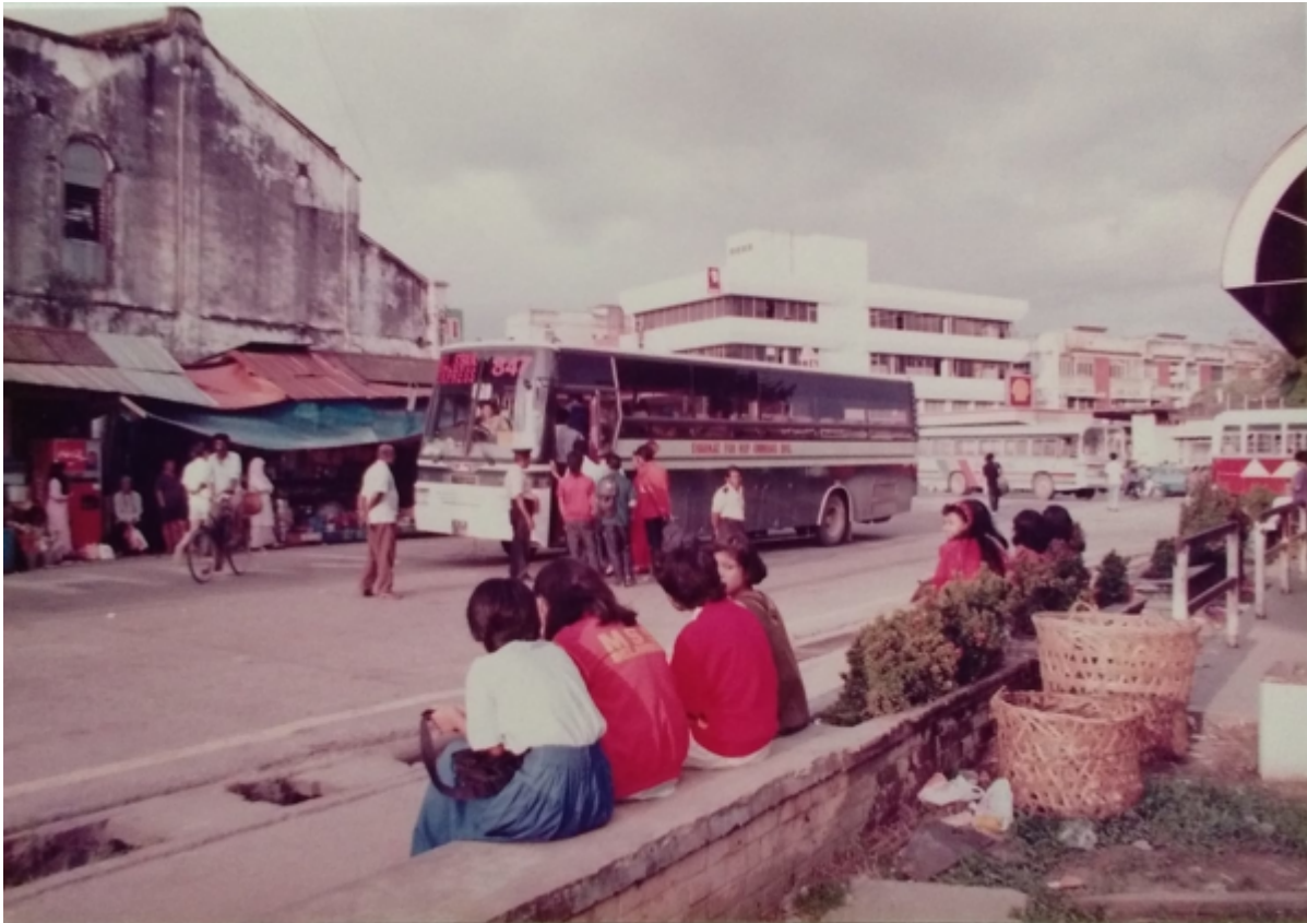
"Suatu masa dahulu di Bandar Kajang. Kredit : Tapa Seni Rimba" (Facebook Bandar Kajang, 28 November 2020: