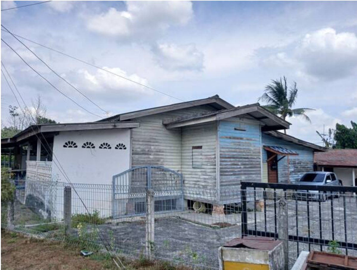
Surau asal yang diperbuat daripada kayu.

“Surau Al- Ittihad terletak di Jalan 1/5 Seksyen1, Bandar Baru Bangi. Penduduk di kawasan ini terdiri daripada 260 unit rumah, 8 unit kedai satu tingkat, 15 unit kedai dua tingkat, 1 unit pasar dan terdapat 25 unit gerai makanan. Kepadatan penduduk di Seksyen 1 ialah 99 peratus berbangsa Melayu dan beragama Islam dan 1% mewakili penduduk berbangsa Cina dan India. Sedikit sebanyak perkara ini menjelaskan bagaimana gambaran kawasan di sekitar Surau Al- Ittihad di Bandar Baru Bangi.