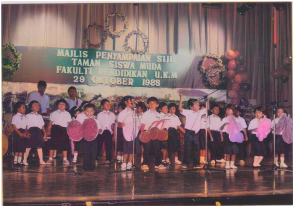
"Tadika Tunas UKM ditubuhkan pada sekitar tahun 1980 yang ketika itu dikenali sebagai Taman Siswa