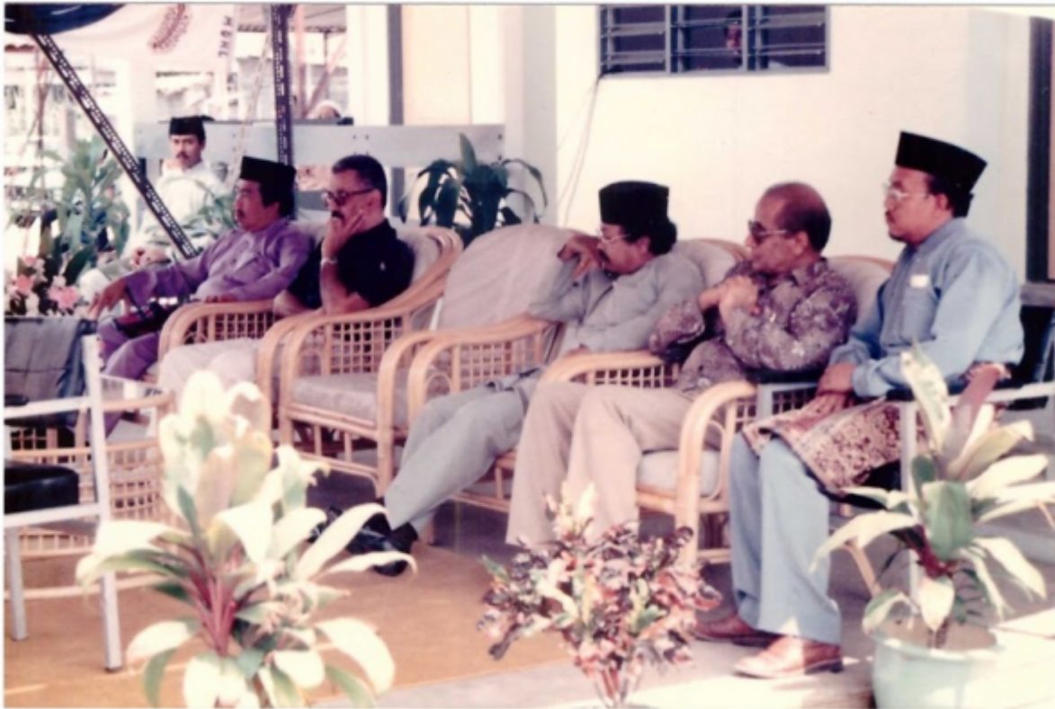
Majlis perasmian Surau As-Sobah, pada 11 Mac 1990.