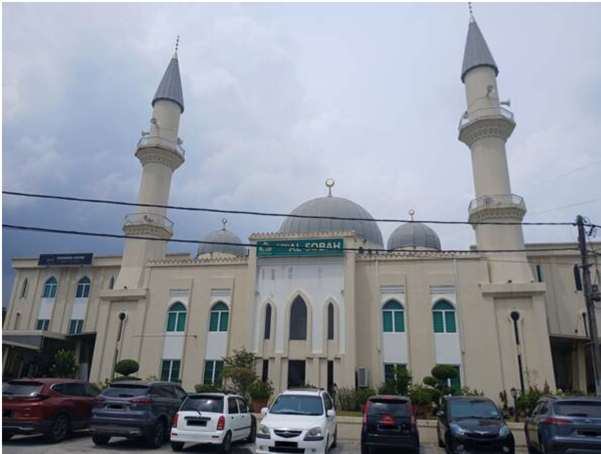
Surau As-Sobah kini.