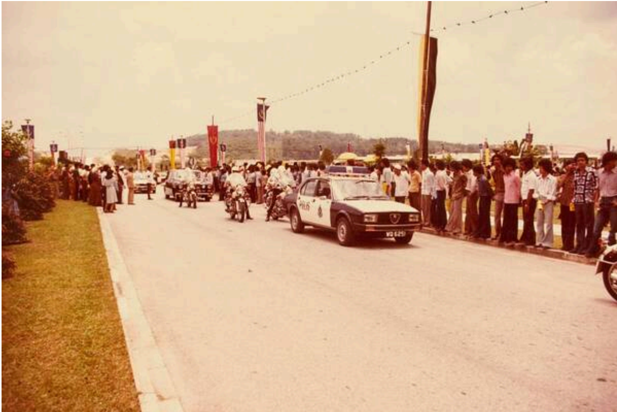
Pemandangan menghala balik dari masjid. Gambar ketika perasmian UKM pada 2 September 1980. Gambar dilitari bukit di sebelah bulatan utama BBB (kini sekitar EzyDurian, Beverly School, dan Klinik Kesihatan). (Universiti Kebangsaan Malaysia - UKM @ Facebook, 27 April 2016: " TAHUKAH ANDA ").