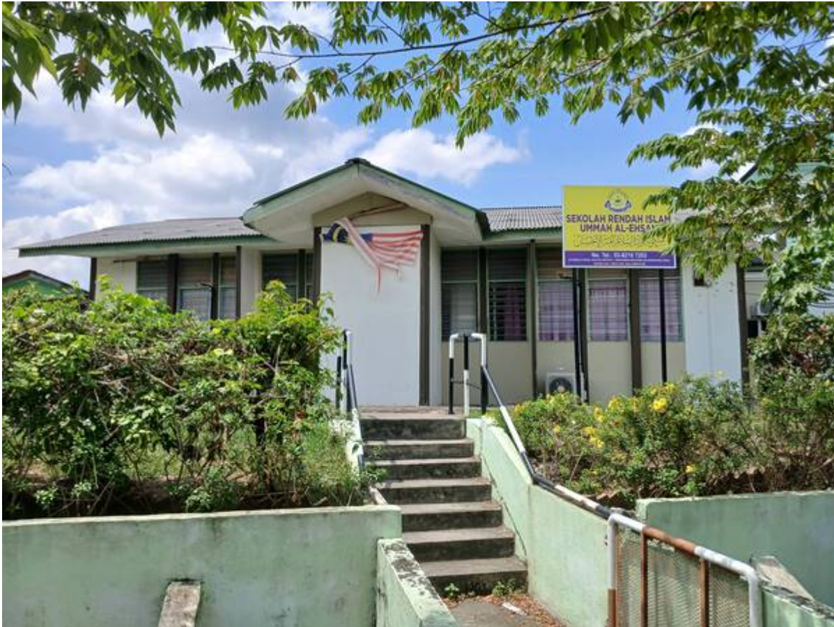
Tahfiz ABIM, kini SRI Ummah Al-Ehsan .