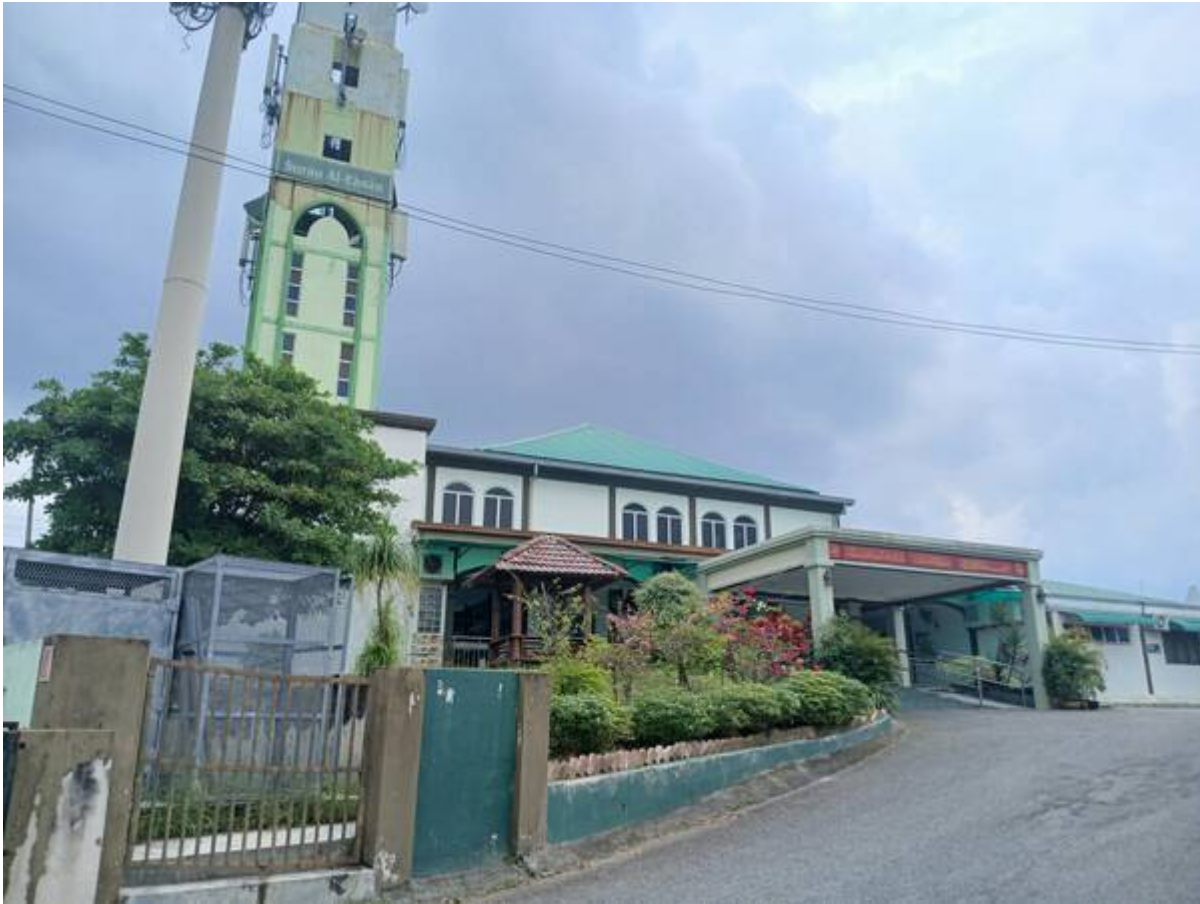
Gambar Surau Al-Ehsan kini