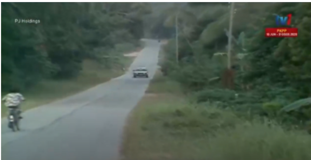
Tangkap layar suatu babak di perkampungan, dalam drama ini