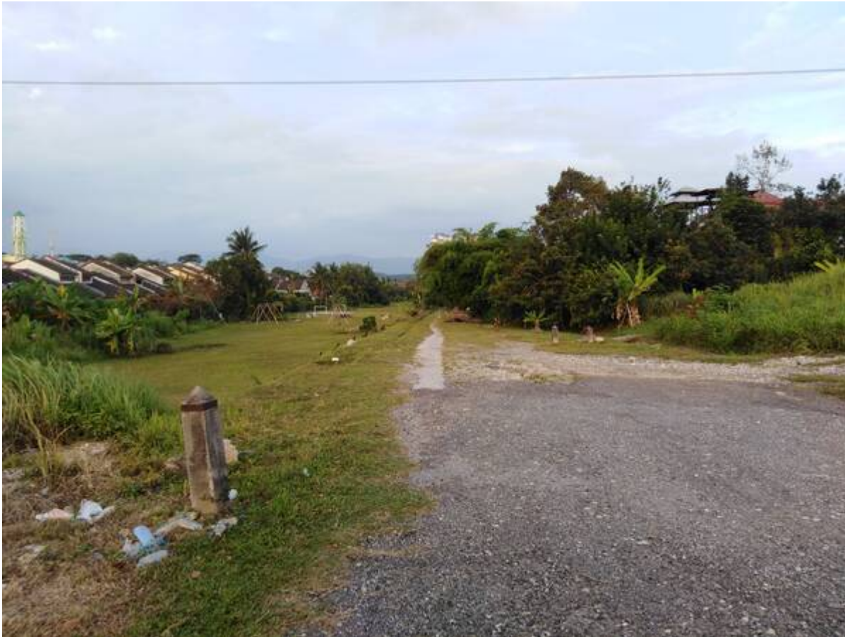
Gambar tahun 2021 (13 Ogos 2021).

Lorong-Lorong Berjalan Kaki / Berbasikal: "Perkara yang penting dalam rancangan Bandar Baru ini ialah konsep mengutamakan kegunaan lorong-lorong berjalan kaki dan lorong berbasikal, yang akan menyambungkan segala aktiviti-aktiviti satu-satu kawasan kediaman dengan yang lain dibandar tersebut. Lorong-lorong ini akan dapat dilihat sebagai satu tempat perkembangan bagi kawasan sekelilingnya dengan adanya kemudahan-kemudahan sosial, pelajaran dan lain-lain lagi disepanjang jaraknya. Tempat-tempat perhentian bas akan diadakan ditakat mana lorong-lorong tersebut bertemu dengan jalan besar. Lorong-lorong ini menyediakan rangka asas bagi menghubungkan kawasan-kawasan dan penduduk-penduduk sekitar." (Sumber: PERBADANAN KEMAJUAN NEGERI SELANGOR (PKNS) @ Arkib Negara 2006/0033913W, 31/12/1974: