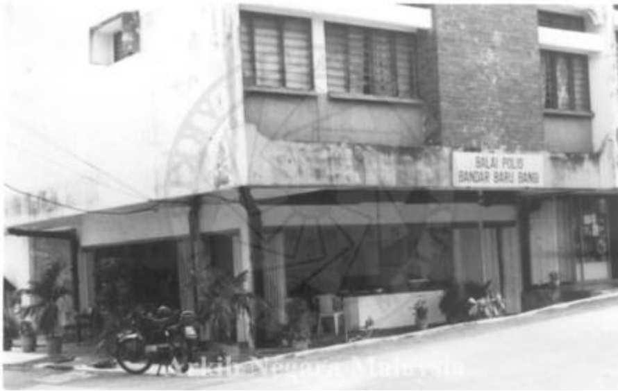
“BALAI POLIS BANDAR BARU BANGI. TARIKH BALAI - IBU PEJABAT POLIS DAERAH KAJANG, NEGERI SELANGOR” (Arkib Negara, 1998: