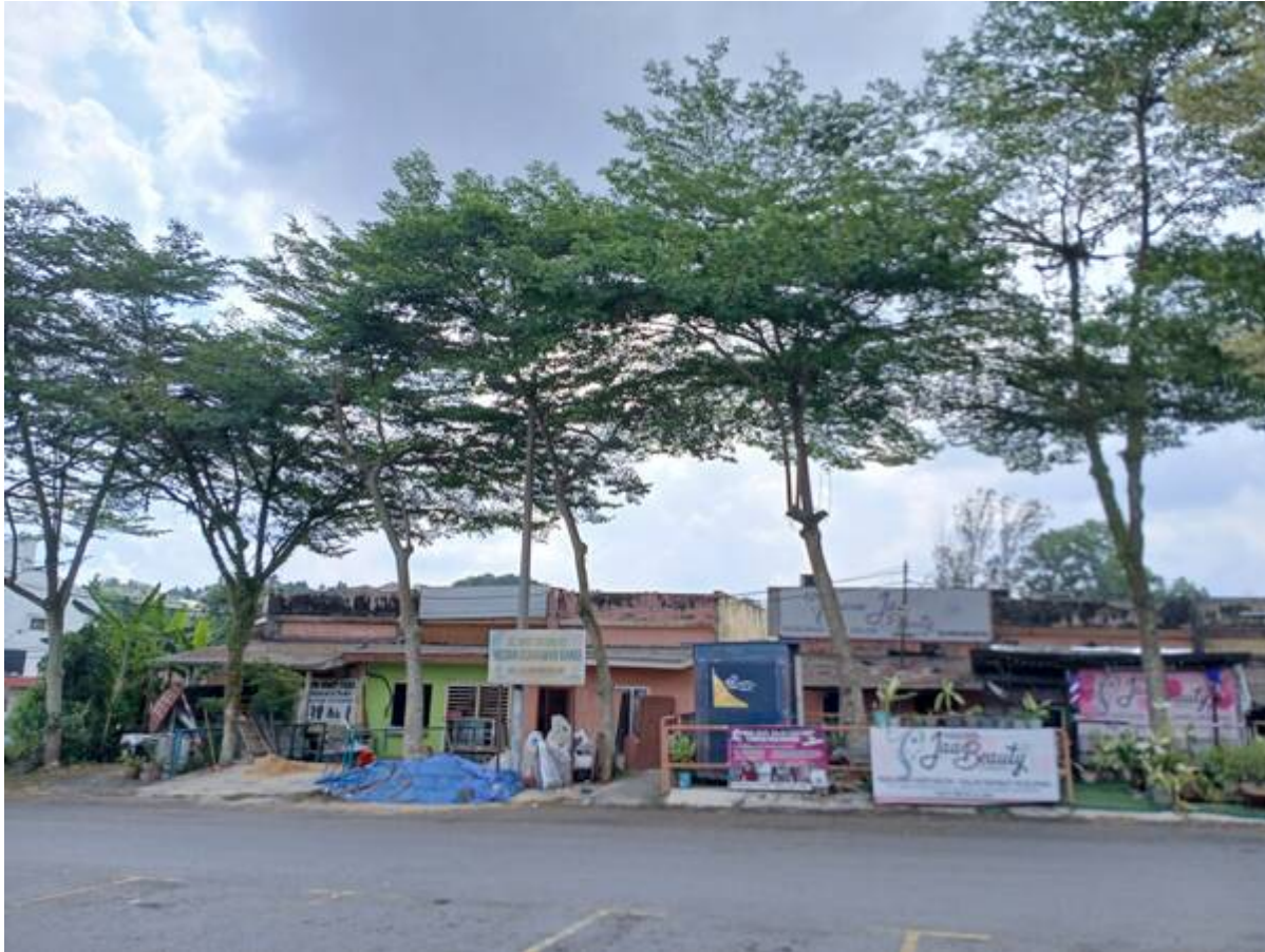
Medan Usahawan Bangi (Gambar: Sazli Shahrir, 2025).

1980-an: Tapak pasar malam. Beli tauhu sumbat dan asam buah cermai.