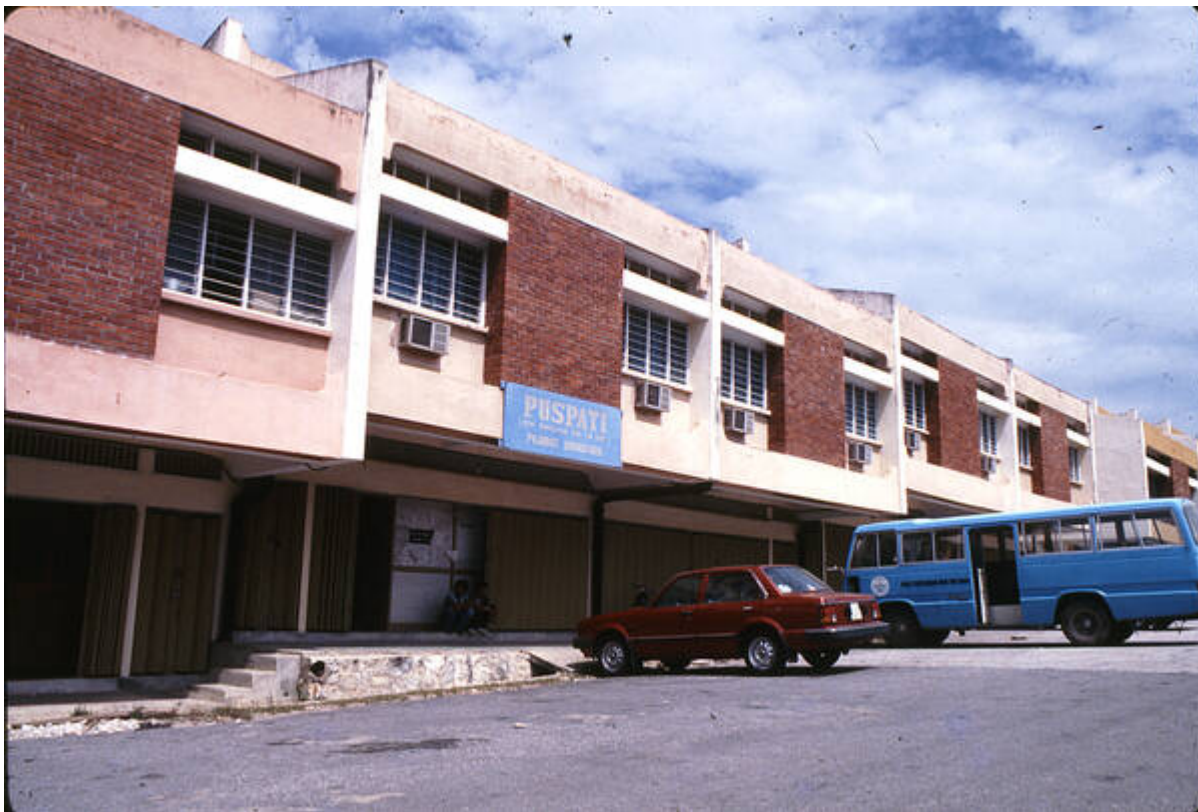
Pejabat Sementara PUSPATI di No. 4, Jalan 1/4, Bandar Baru Bangi, sekitar 1981-1982. Sumber-sumber alamat:-