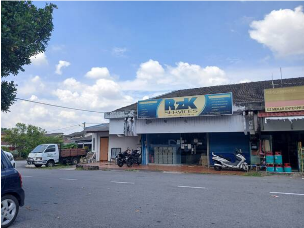
(Gambar: Sazli Shahrir, 2025)