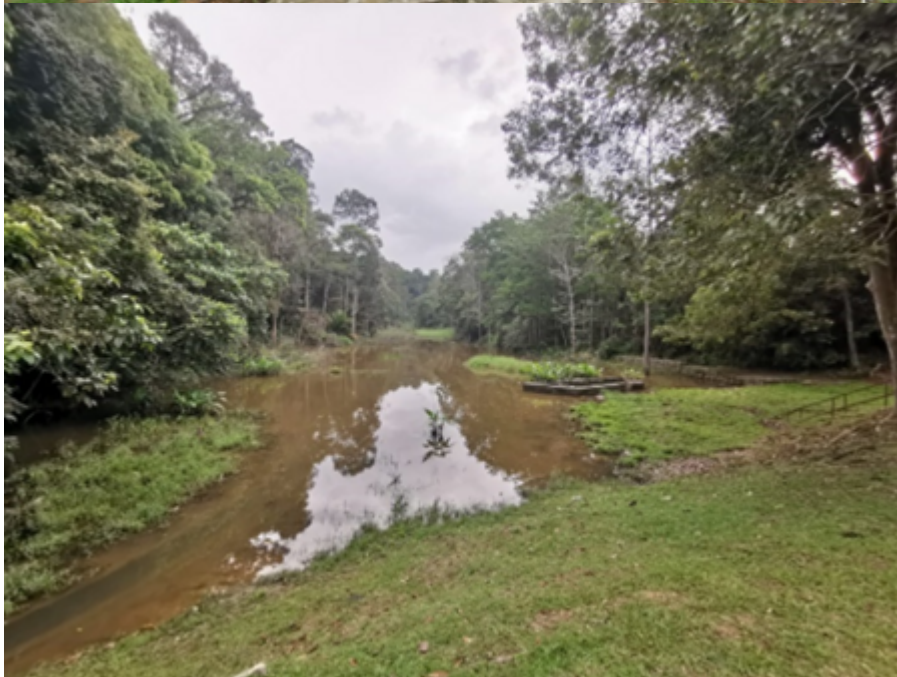
Tasik Ghazali pada 25 Oktober 2023.