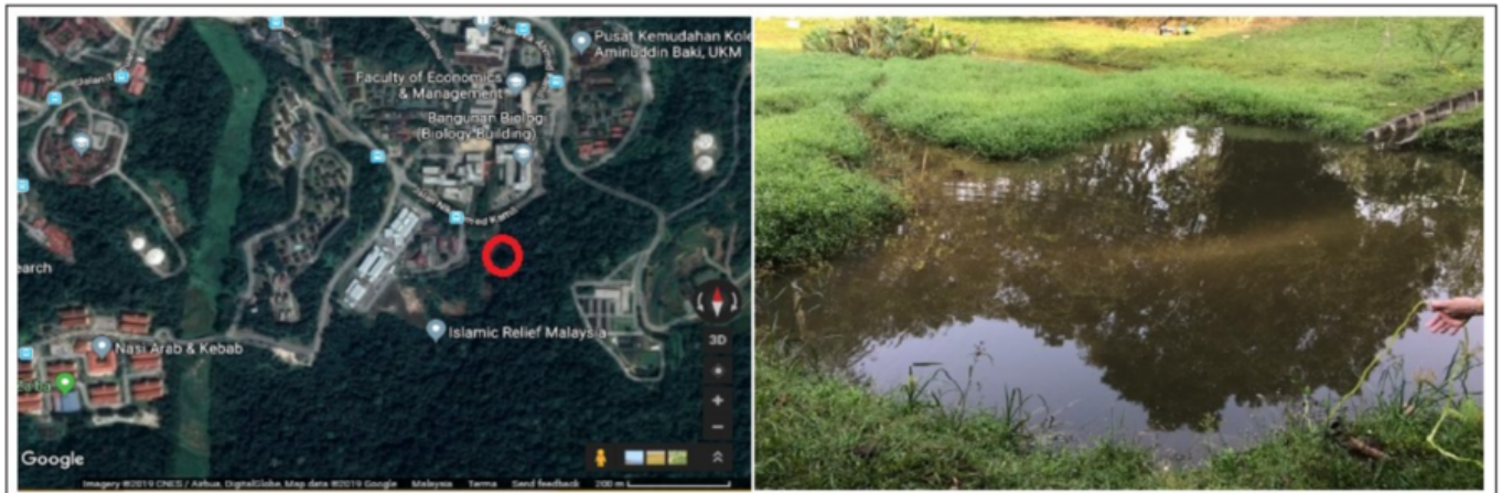
“Koordinat bagi lokasi kajian ini adalah 2.922107, 101.781739 dan terletak berdekatan dengan Bangunan Sains Nuklear (Rajah 1). Tasik Ghazali adalah salah satu tasik semulajadi yang wujud sejak penubuhan UKM pada tahun 1970-an dan pada asalnya merupakan sebuah tasik yang besar serta