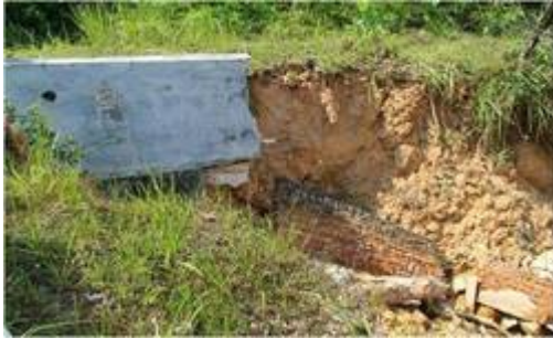
“Sisa runtuh dari Fakulti Sains Teknologi (FST) memasuki Tasik Ghazali dan menyebabkan kelodak/lumpur.”

(Sumber: Sungai Alur Ilmu UKM @ Facebook, 15 Ogos 2014: "PUNCA 1. SISA RUNTUHAN DI FST" ).