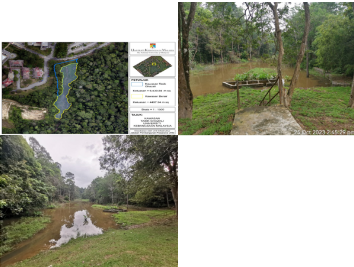
“Retention pond in UKM and its capacity ... As for the retention pond, Ghazali Lake is among the water conservation system that is used as a water source for landscaping works.”

Tasik Ghazali adalah tasik semulajadi yang dijadikan sistem penakungan air, sebagai sumber perairan kerja-kerja landskaping di UKM.