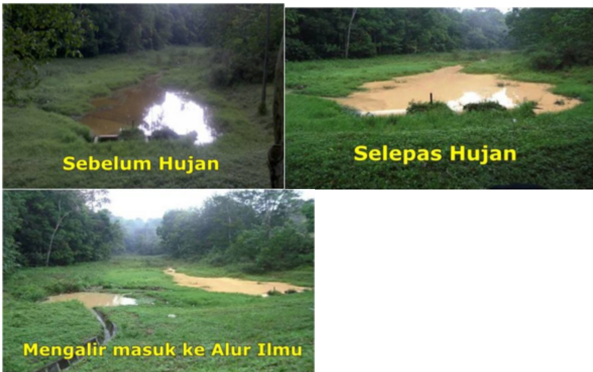
“Berpunca dari Sungai Anak Bangi ~ Dikhuatiri terdapat kawasan pelupusan tanah tetapi tidak boleh di akses disebabkan kawasan berlumpur.”