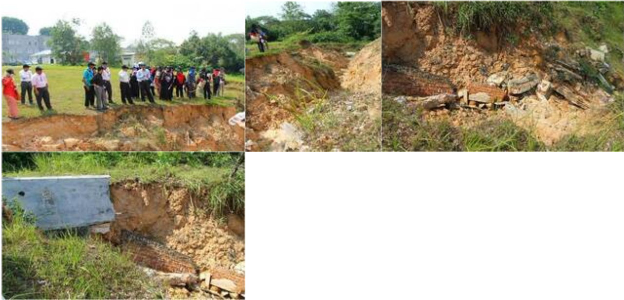
“Sisa runtuhan daripada Fakulti Sains Teknologi (FST) memasuki Tasik Ghazali dan menyebabkan kelodak/lumpur.”