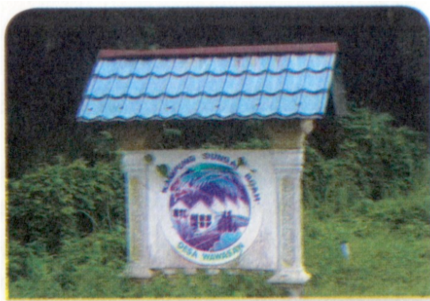
“Papan tanda kampung di Kampung Sungai Buah.”

Peneroka-peneroka ini pada mulanya hanya meneroka kawasan di tepi sungai. Ketika berehat di tepi sungai tersebut, mereka mendapati terdapat banyak buah kelepong (tumbuhan, Randia exaltata ) di dalam sebuah parit. Parit itu dikenali sebagai Parit Sungai Buah. Buah kelepong ini warnanya hijau keputihan. Pokok dan getahnya juga berwarna putih. Apabila buah ini dimasak, ia berwarna kuning. Pokok ini dikatakan masih wujud sehingga kini. Mengambil sempena banyaknya buah kelepong di kawasan ini maka tempat itu pun dinamakan Sungai Buah.”