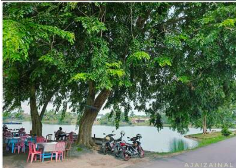
Kiri: "Port santai-santai (Laman Tasik impian kampung Sungai buah). Nak santai-santai tak perlu