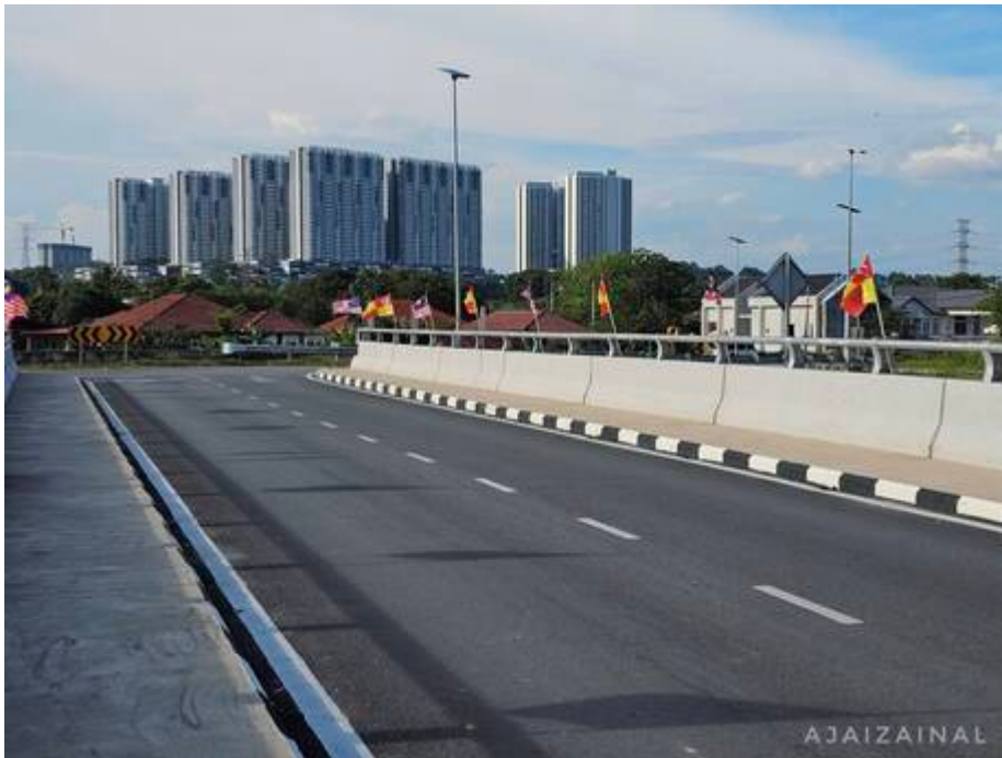
"Jambatan Sungai Buah dahulu