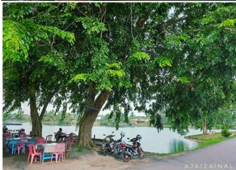
Kiri: "Port santai-santai (Laman Tasik impian kampung Sungai buah). Nak santai-santai tak perlu jauh-jauh. Jemput Datang ke kampung sungai buah. Boleh riadah bersama keluarga, Boleh memancing