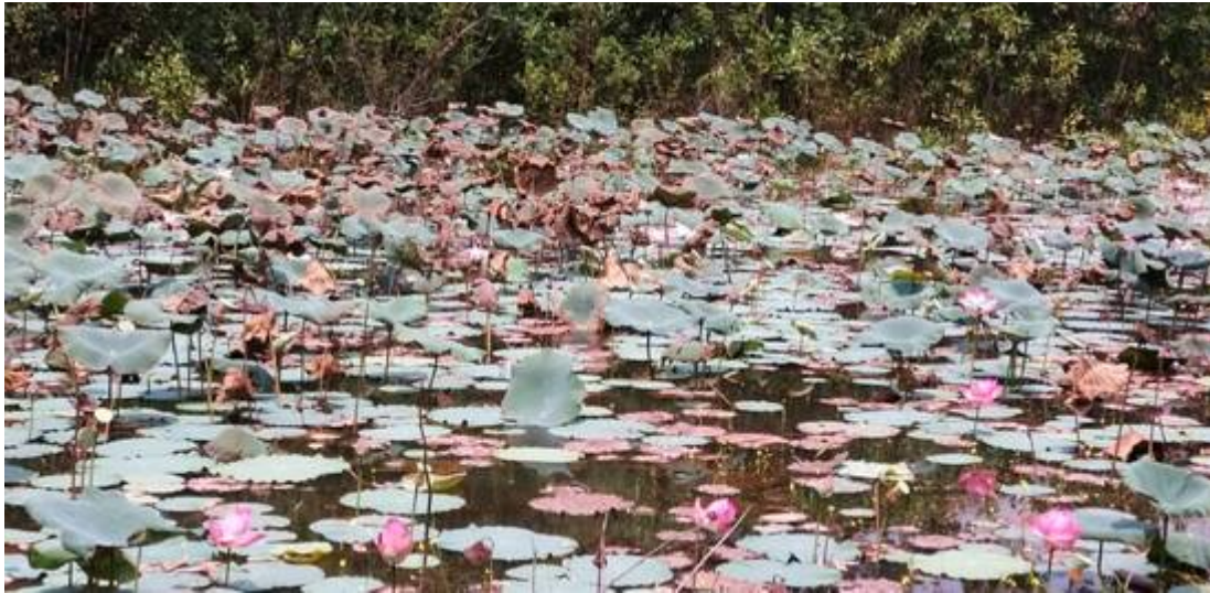
Tasik Idaman, Kg Sg Buah, kini (Kiri: Ying How and Ai Ling @ Kuala Lumpur Mountain Bike Hash (KLMBH), 28/07/2019:

"KLMBH #293 KAMPUNG SUNGAI BUAH". Kanan: Kuala Lumpur Mountain Bike Hash (KLMBH):