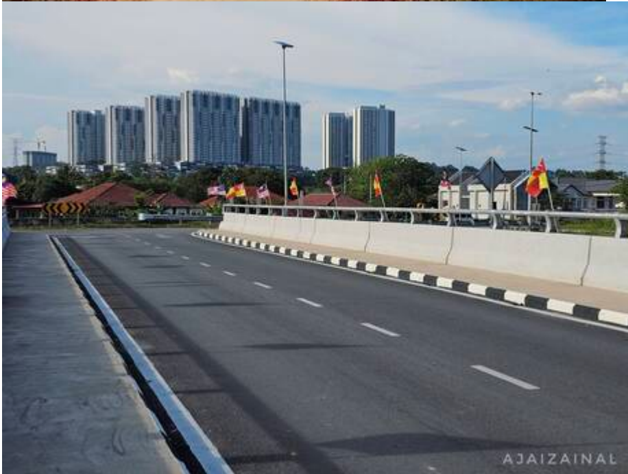
"Jambatan Sungai Buah dahulu & sekarang...dulu kayu sekarang konkrit." ( Kiri: 1986; Kanan: 2025; Faizal Zainal @ Facebook Pekan Bangi, 23 September 2025: " Jambatan Sungai Buah... ").