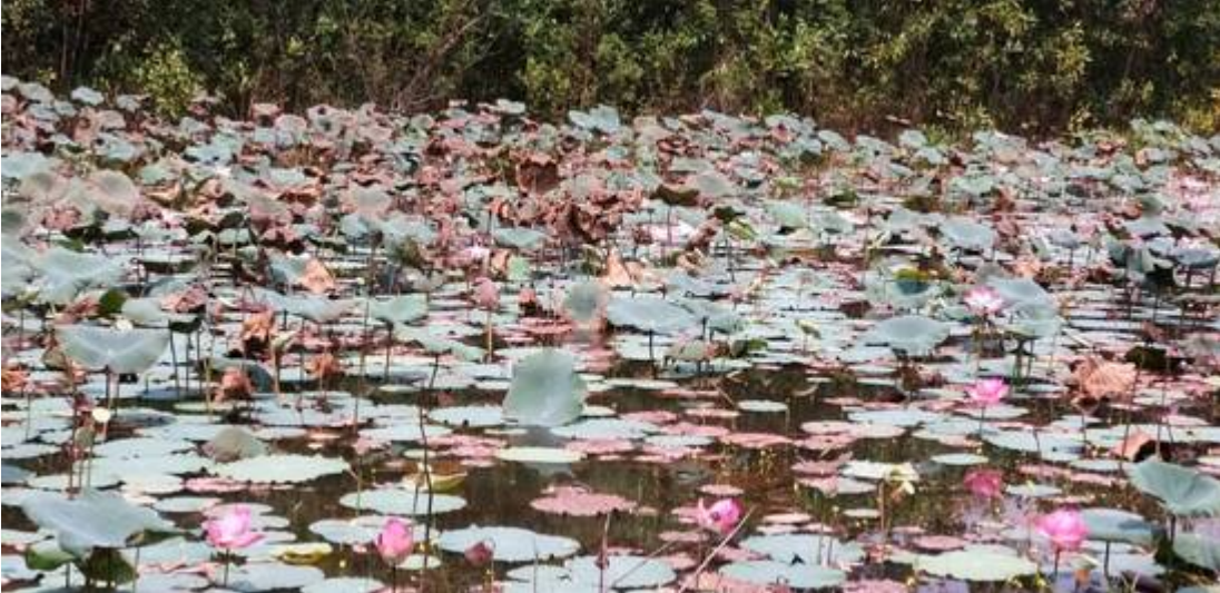
Tasik Idaman, Kg Sg Buah, kini (Kiri: Ying How and Ai Ling @ Kuala Lumpur Mountain Bike Hash (KLMBH), 28/07/2019:

| "KLMBH #293 KAMPUNG SUNGAI BUAH". Kanan: Kuala Lumpur Mountain Bike Hash (KLMBH):