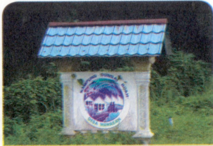
“Papan tanda kampung di Kampung Sungai Buah.”

Peneroka-peneroka ini pada mulanya hanya meneroka kawasan di tepi sungai. Ketika berehat di tepi sungai tersebut, mereka mendapati terdapat banyak buah kelepung (tumbuhan, Randia exalfata ) di dalam sebuah parit. Parit itu dikenali sebagai Parit Sungai Buah. Buah kelepung ini warnanya hijau keputihan. Pokok dan getahnya juga berwarna putih. Apabila buah ini dimasak, ia berwarna kuning. Pokok ini dikatakan masih wujud sehingga kini. Mengambil sempena banyaknya buah kelepung di kawasan ini maka tempat itu pun dinamakan Sungai Buah.”