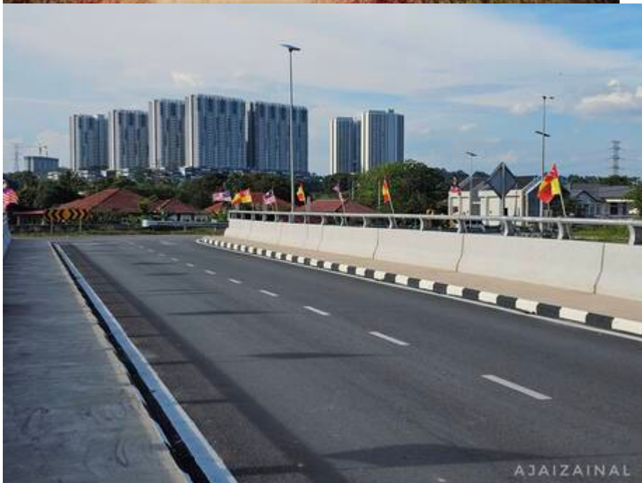
"Jambatan Sungai Buah dahulu & sekarang...dulu kayu sekarang konkrit." (Kiri: 1986; Kanan: 2025