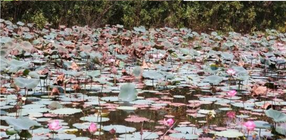
Tasik Idaman, Kg Sg Buah, kini (Kiri: Ying How and Ai Ling @ Kuala Lumpur Mountain Bike Hash (KLMBH), 28/07/2019:

| "KLMBH #293 KAMPUNG SUNGAI BUAH". Kanan: Kuala Lumpur Mountain Bike Hash (KLMBH):