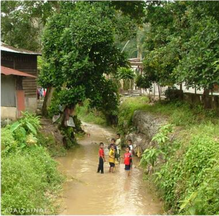
"Foto Tahun 2003, lokasi belakang rumah Pak Long Musa, berdekatan rumah Cik Iti dan Masjid Bangi." (Kiri: Faizal Hj Zainal , September 14, 2008:

| "Sejarah Bangi"; Kanan: (Faizal Zainal @ Facebook Pekan Bangi, 29 Oktober 2025: "Nostalgia Bangi: Jelajah Sungai Bangi.").