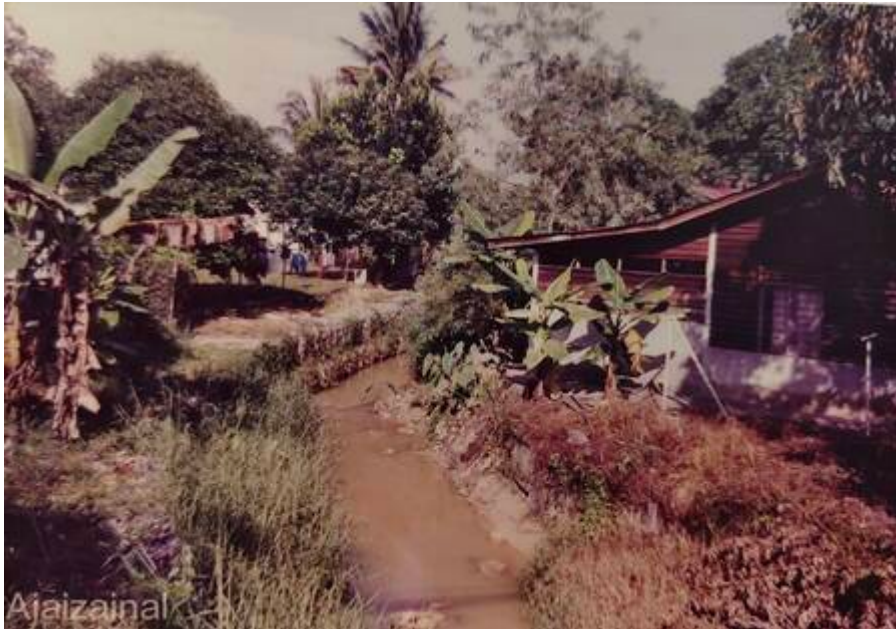
“Sungai Bangi di musim paneh sekitar tahun 1992 -93. Dulu - dulu kalau hari paneh sangat, pergilah ke kedai hobbee atau kedai Cina Janda beli air gas sejuk F&N 60 sen sebotol diminum togok bagi pueh, air tebu 30 sen secawan di bawah pokok ketapang atau ais kepal kedai Botak... di isap - isap ais kepal tu sambil jalan balik sekolah. Kalau orang tuo - tuo dulu air barli ais kedai mamak Ajmeer pilihannya bagi penyejuk badan di musim paneh macam sekarang ni ha. .... di tepi Masjid Bangi di atas jambatan Sg. Bangi” (Faizal Zainal @ Facebook Pekan Bangi, 29 Mac 2026: "Nostalgia Bangi" ).