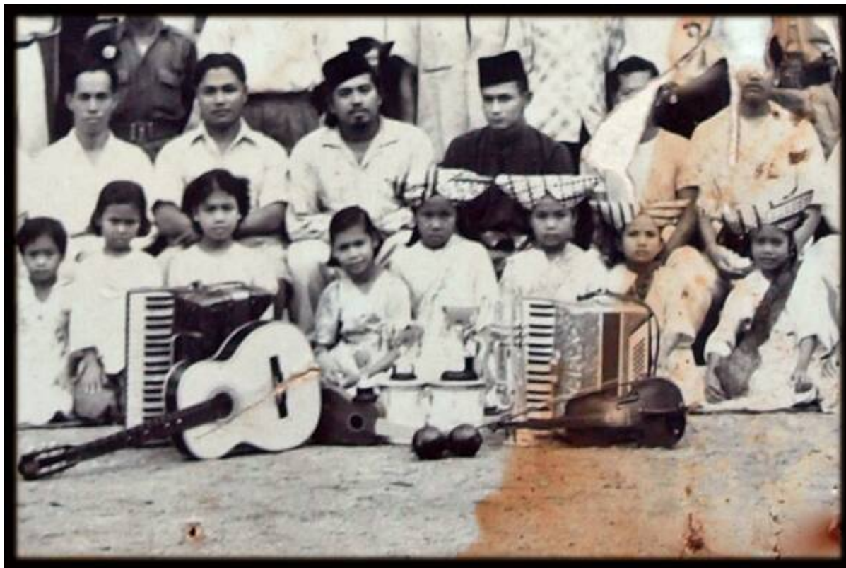
Gambar hiasan: Bangi, 1956 (Faizal Hj Zainal, September 14, 2008: