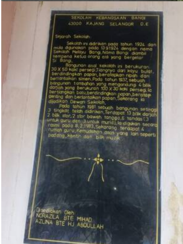
Gambar terkini bangunan asal sekolah (11 Februari 2022). Di sebelah kanan ialah pelak sejarah bangunan ini.