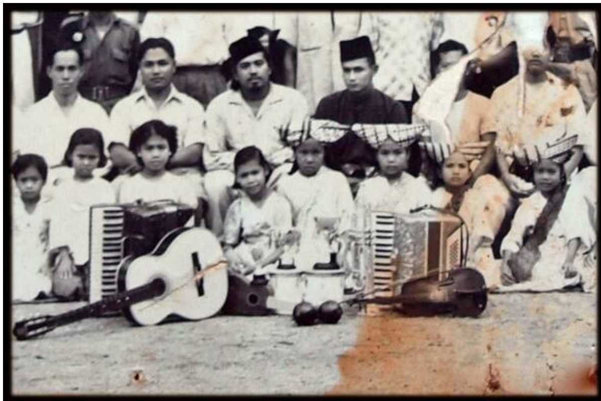
Gambar hiasan: Bangi, 1956 (Faizal Hj Zainal, September 14, 2008: