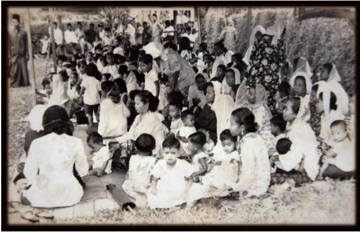
Gambar hiasan: "Kaum Ibu semasa majlis Maulid Nabi Sekitar tahun 50an" (Faizal Hj Zainal, September 14, 2008: