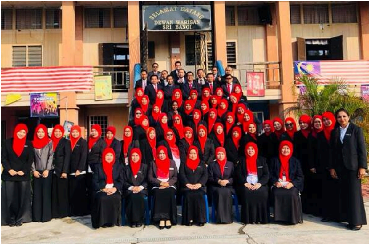
Bangunan tambahan sekolah (dibina 1937), kini Dewan Warisan (Sumber gambar: Facebook SK BANGI - RASMI , 28 Disember 2019).