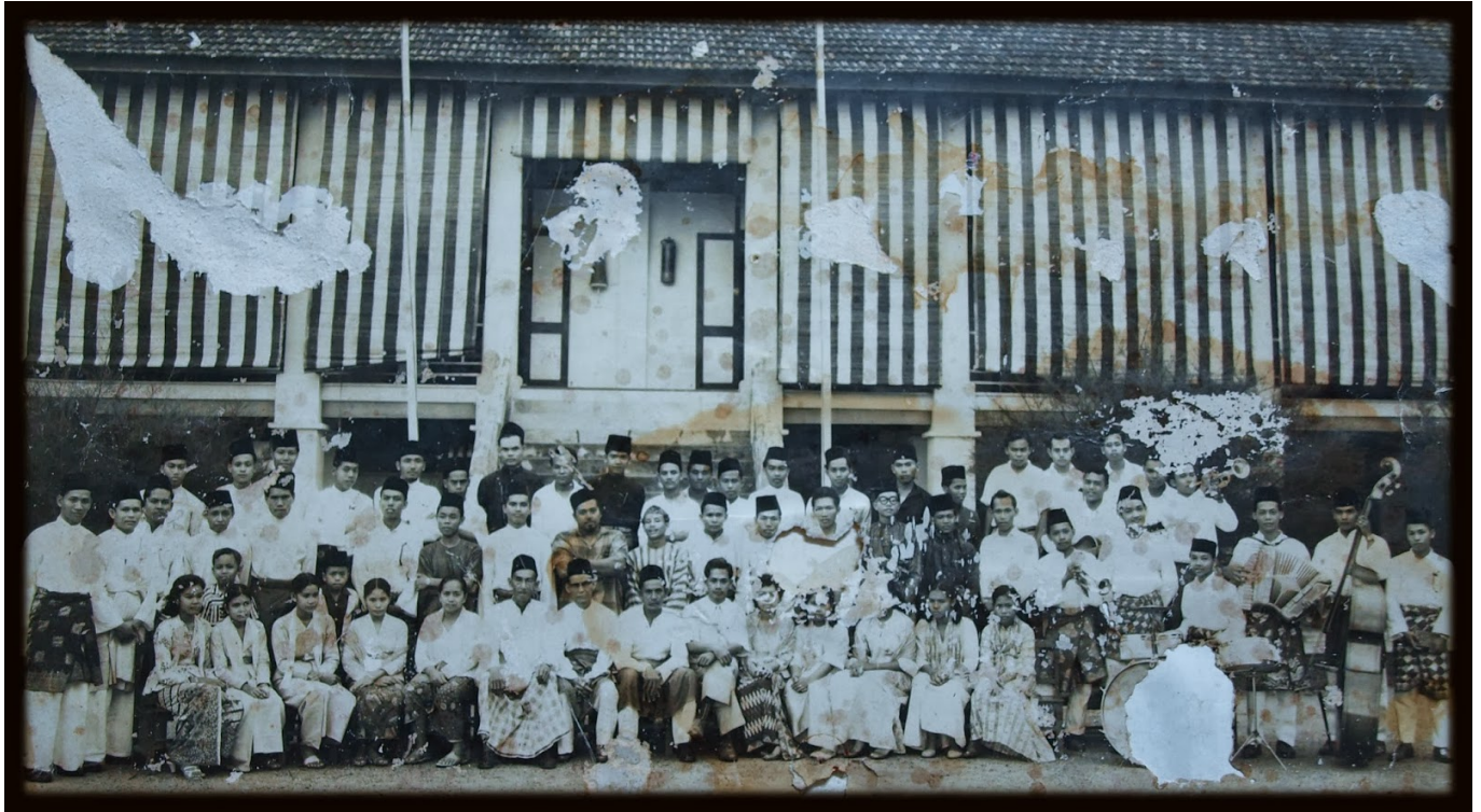
Dewan Lama Sekolah Melayu Bangi (Tarikh tidak diketahui)

Bangunan tambahan ini mungkin dibina menggunakan dana kerajaan yang telah diumumkan pada 14 November 1936 .