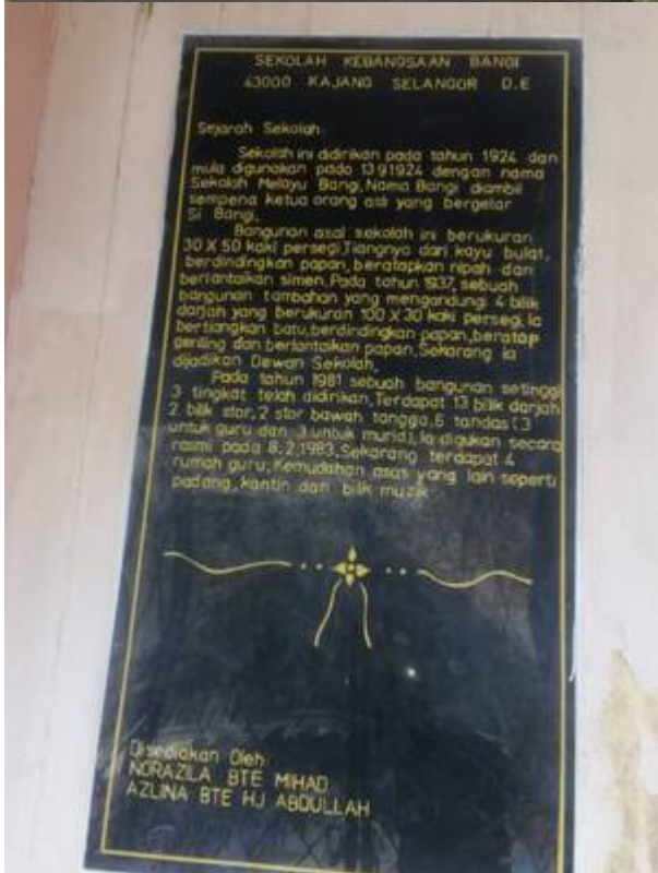
Gambar terkini bangunan asal sekolah (11 Februari 2022). Di sebelah kanan ialah pelak sejarah bangunan ini.