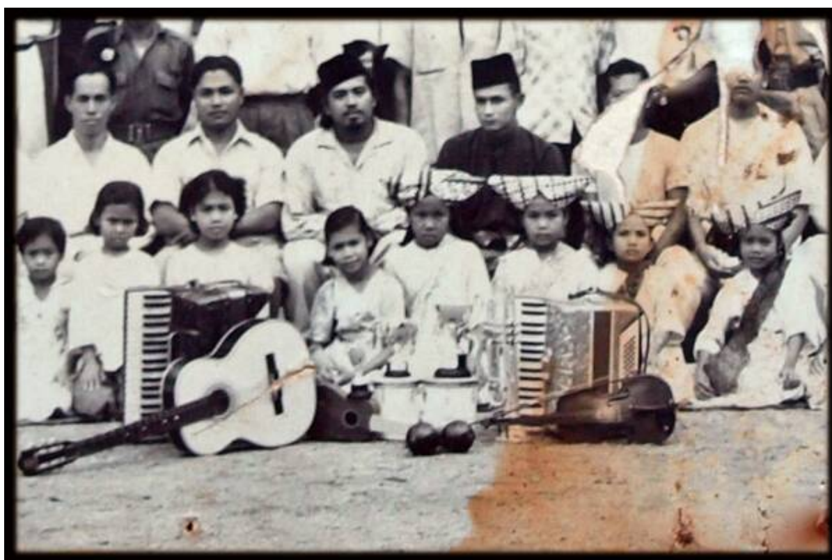
Gambar hiasan: Bangi, 1956 (Faizal Hj Zainal, September 14, 2008: