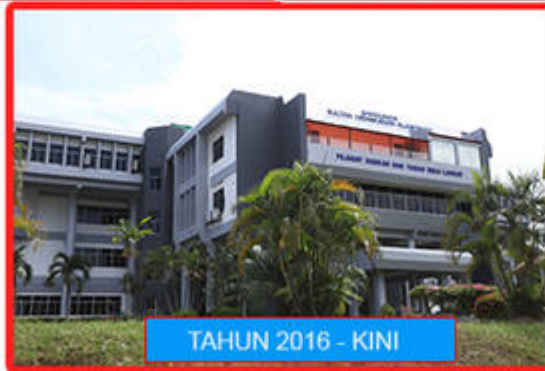
TAHUN 2016 - KINI