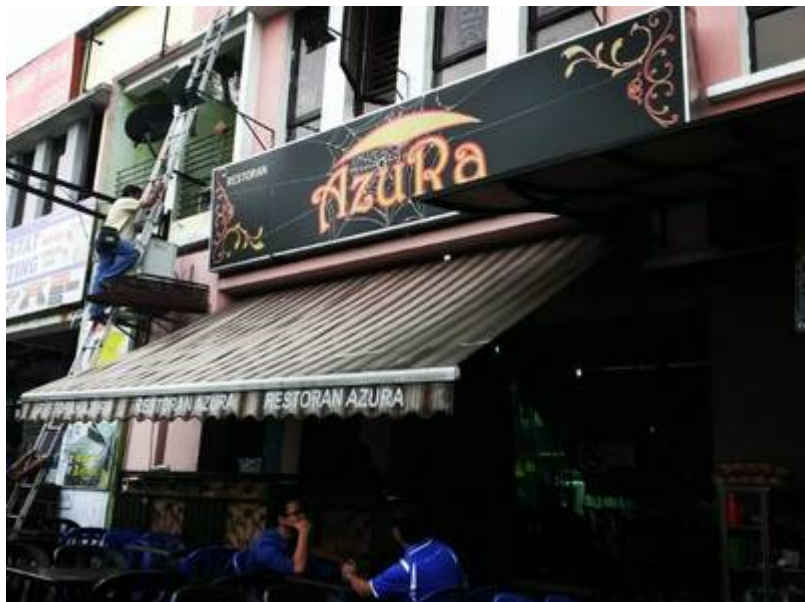
"Restoran Azura Seksyen 3 Bandar Baru Bangi".