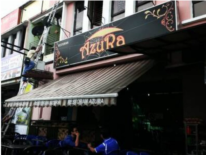
"Restoran Azura Seksyen 3 Bandar Baru Bangi".