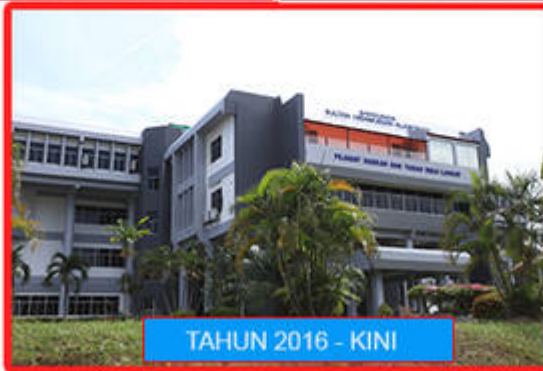
TAHUN 2016 - KINI