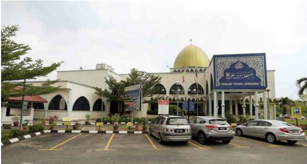
"MASJID Teras Jernang di Bangi."