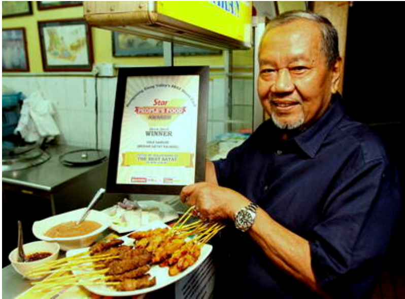
“Sate Kajang Haji Samuri wins The Star People’s Food Awards” (Noel Foo @ Kualu:

“Sate Kajang Haji Samuri wins The Star People’s Food Awards”).