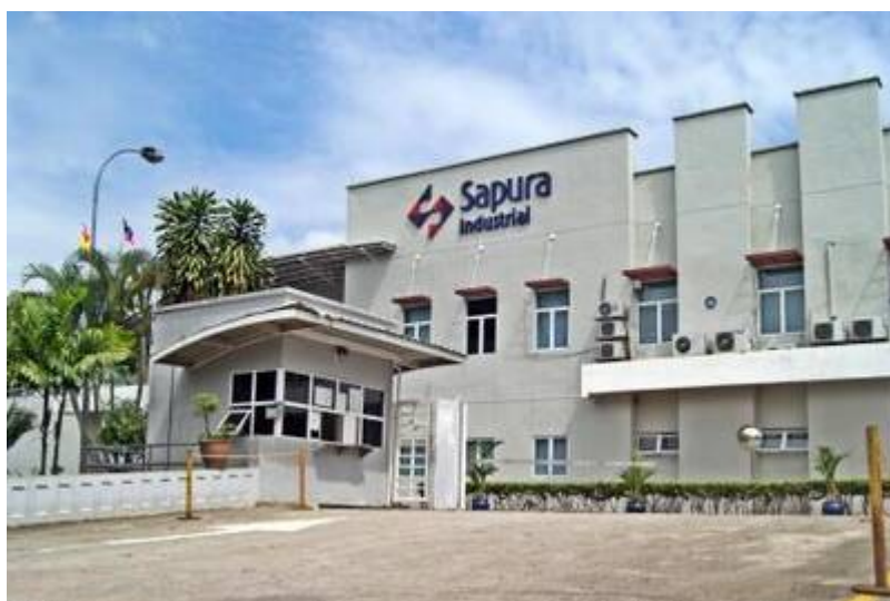
“Corporate HQ & Stabiliser Bar Plant, Bangi.”