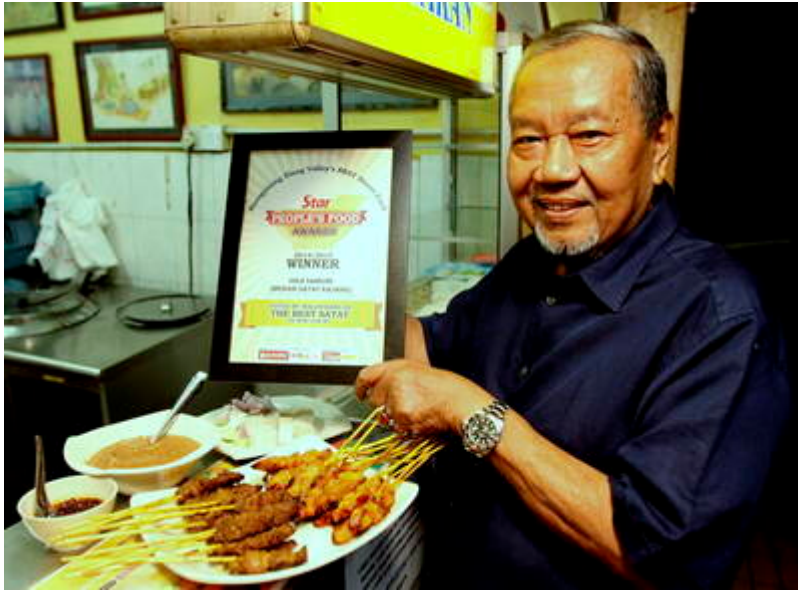
“Sate Kajang Haji Samuri wins The Star People’s Food Awards”

“Sate Kajang Haji Samuri wins The Star People’s Food Awards”).