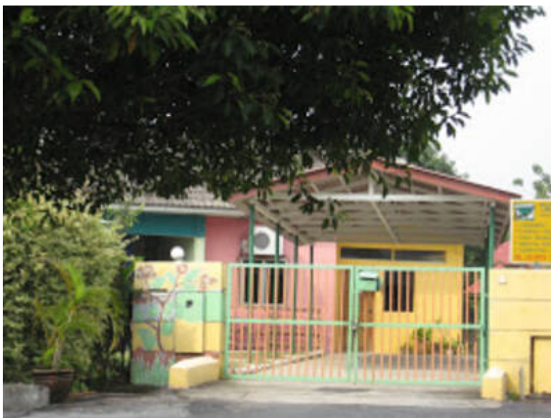
"Tadika Aulad Main Branch. No: 11A Jalan 3/6G, Bandar Baru Bangi"