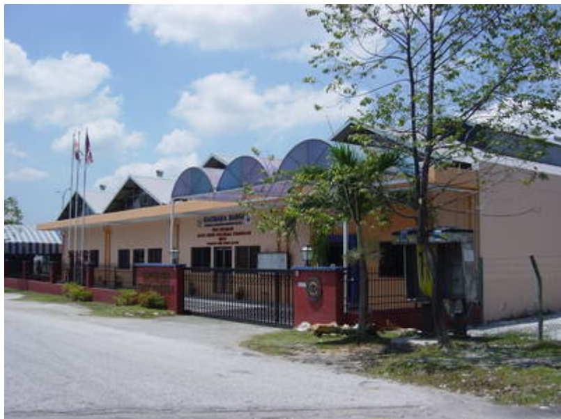
"Bangunan GIATMARA Bangi" (GIATMARA Bangi, 2008:

"GIATMARA BANGI (Teknologi Percetakan)".