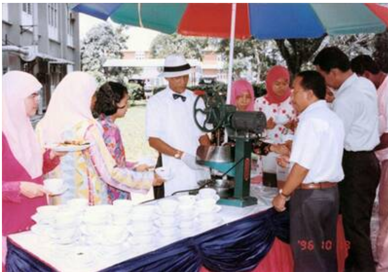
Gambar peringkat awal Sofi Catering (19/10/1996).

"A Malaysian Caterer based in Bandar Baru Bangi, established since 1995. Here at Sofi Catering we focus on HATS - Hospitality, Ambience, Taste and Style."