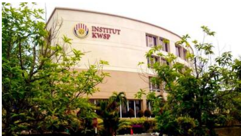
“ELC Building or formerly known as Institut KWSP” (EPF Learning Campus @ Facebook, 24 Julai 2015).

“EPF has fully explored various strategies that further protected its role in protecting the contributions of employees. This eventually led to the management's decision that members' interests would be further enhanced through higher level of professionalism in leadership and management. Hence, the EPF decided to broaden the scope of its internal training division and to elevate its status into an actual training institution. Thus, in year 1995, the Employees Provident Fund Social Security Training Institute, otherwise known as ESSET, was born. ESSET is the acronym for EPF Social Security Training Institute. ESSET's main focus is to train and develop EPF's staff, which will lead to enhance the knowledge and skills so that they are competent to produce results expected of them to fulfill EPF's vision and mission. ... Located in Bangi, Selangor Darul Ehsan, Malaysia, strategically within the university town and the Multimedia Super Corridor (MSC), ESSET is also located next to Universiti Kebangsaan Malaysia (UKM).”