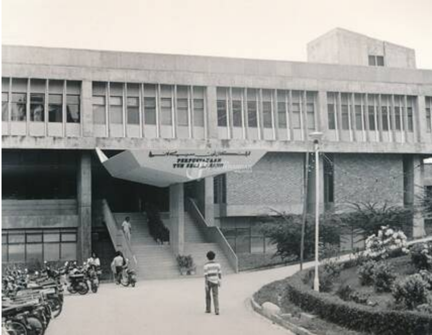
Kiri: "Pemandangan dari luar Perpustakaan Tun Sri Lanang, Universiti Kebangsaan Malaysia, Bangi, Selangor. 20.09.1980"

| "Perpustakaan Tun Sri Lanang, Universiti Kebangsaan Malaysia, Bangi, Selangor.").