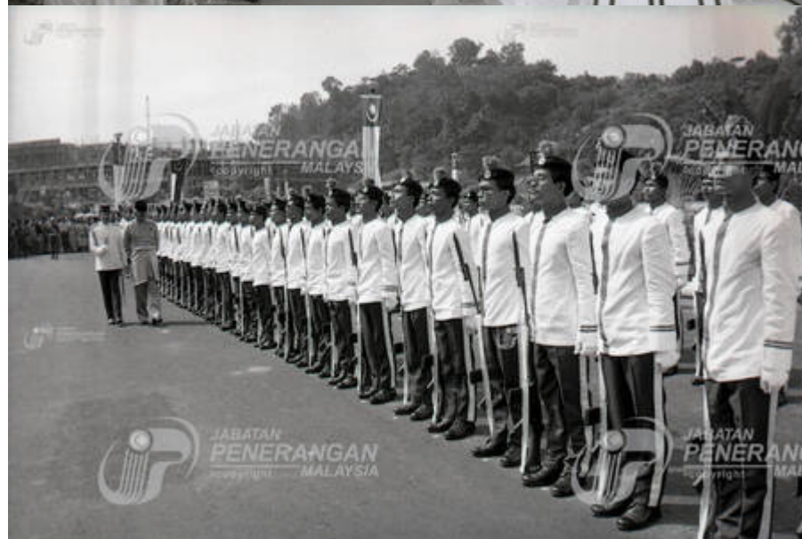
"Majlis Perasmian Kampus Induk Universiti Kebangsaan Malaysia, Bangi, Selangor".