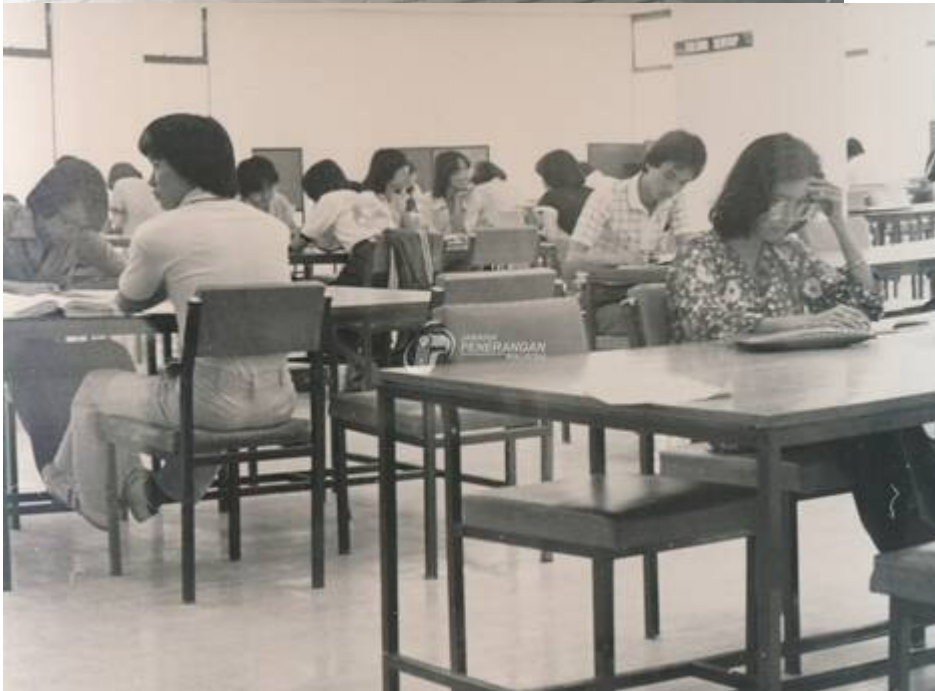
Kiri: "Mahasiswa-mahasiswa memasuki Perpustakaan Tun Sri Lanang, Universiti Kebangsaan Malaysia, Bangi, Selangor. 20.09.1980"

| "Perpustakaan Tun Sri Lanang, Universiti Kebangsaan Malaysia, Bangi, Selangor.").