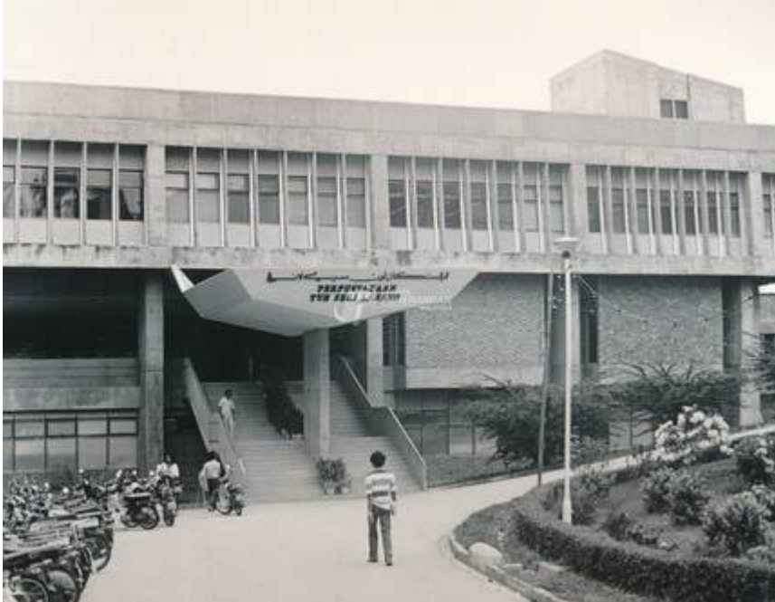
Kiri: "Pemandangan dari luar Perpustakaan Tun Sri Lanang, Universiti Kebangsaan Malaysia, Bangi, Selangor. 20.09.1980"

| "Perpustakaan Tun Sri Lanang, Universiti Kebangsaan Malaysia, Bangi, Selangor.").