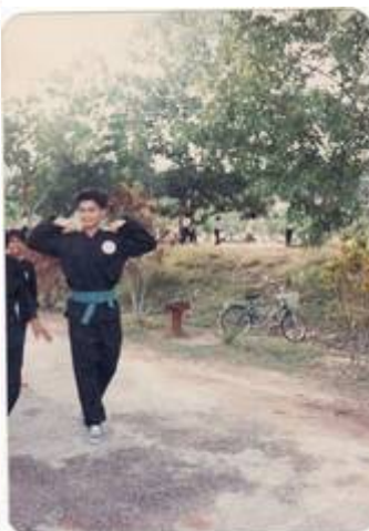
"SRK BBB (Kini SK BBB) 1988"