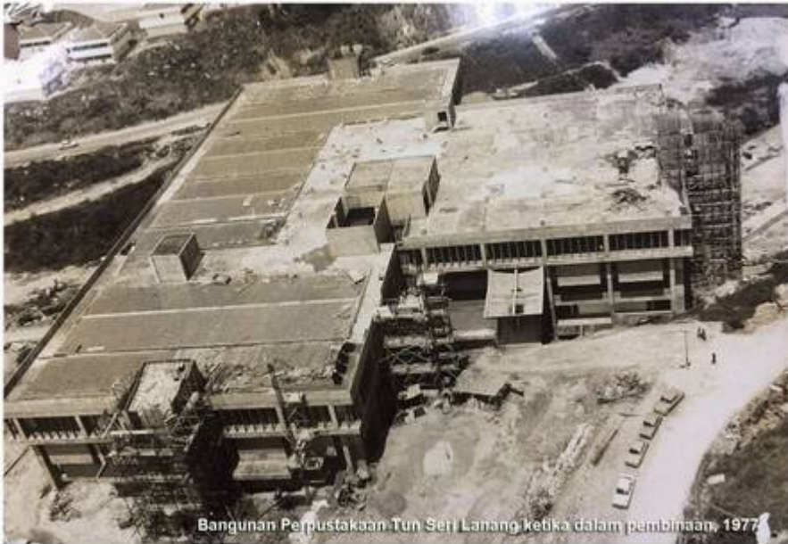
Bangunan Perpustakaan Tun Seri Lanang ketika dalam pembinaan, 1977

yang terbesar di Asia Tenggara dengan keluasan lantai 242,255 kaki persegi. Pada 16 Oktober 1977, perpustakaan UKM di Lembah Pantai dipindahkan buat sementara ke aras 3 dan 5 bangunan Pentadbiran di Bangi, sebelum berpindah ke bangunan baru pada 8 Jun 1978. Ia siap dibina sepenuhnya pada 14 Julai 1978, dan dirasmikan pada 2 Julai 1980.