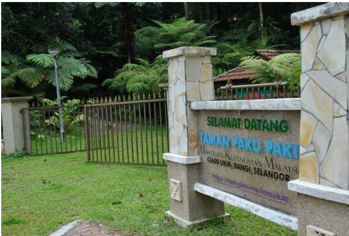
Taman Paku Pakis UKM.