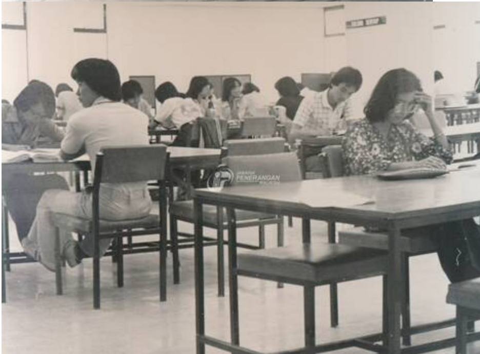
Kiri: "Mahasiswa-mahasiswa memasuki Perpustakaan Tun Sri Lanang, Universiti Kebangsaan Malaysia, Bangi, Selangor. 20.09.1980"

| "Perpustakaan Tun Sri Lanang, Universiti Kebangsaan Malaysia, Bangi, Selangor." ).