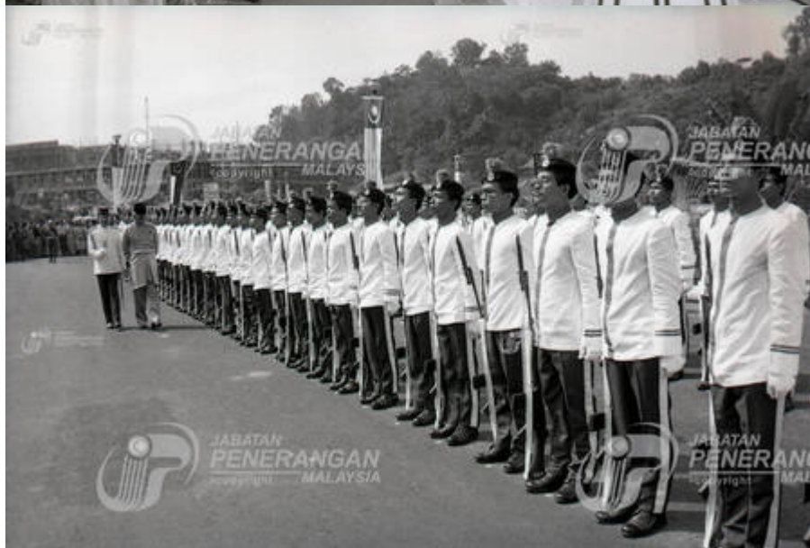
"Majlis Perasmian Kampus Induk Universiti Kebangsaan Malaysia, Bangi, Selangor".