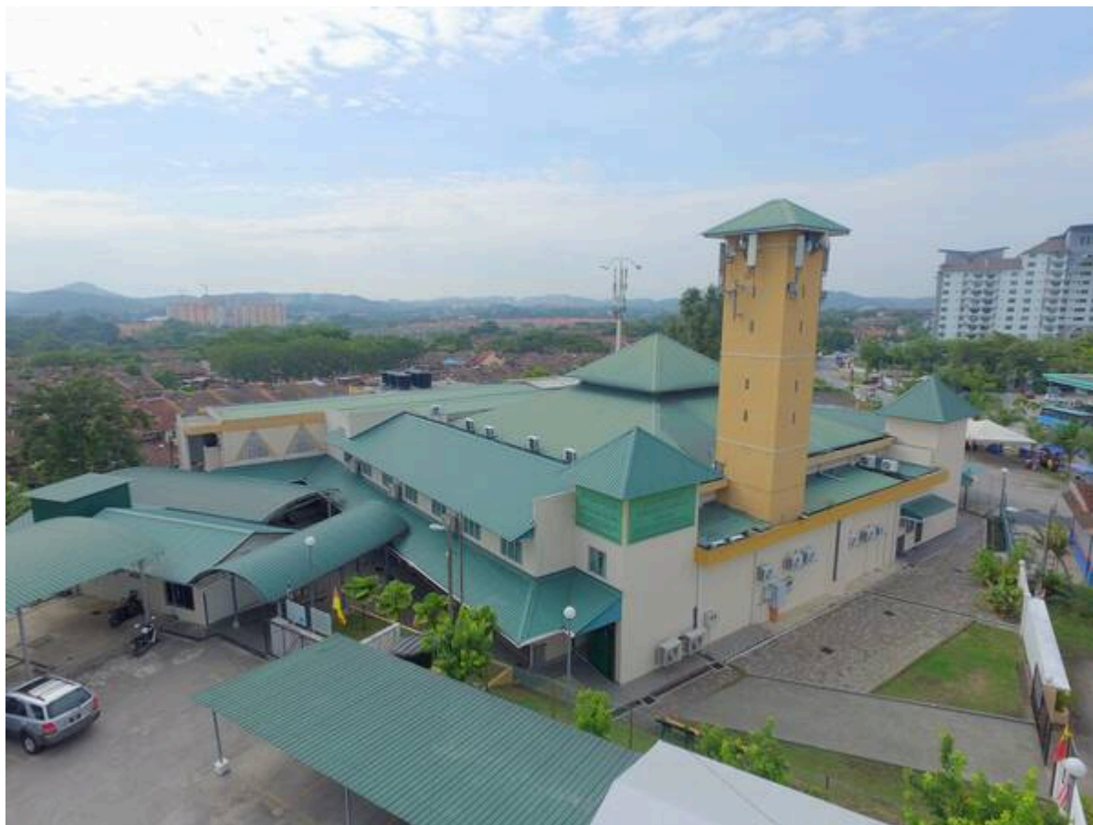
Surau Al Kauthar kini (Facebook:

"Surau Al-Kauthar telah di daftarkan pada 22 Mei, 1987M bersamaan 24 Ramadhan 1407H beralamat di No.71 Jalan 4/6, Fasa 4, BBB (rumah teres). Rujukan Fail JAIS Ruj (2) dlm. JAI. Shah Alam, Selangor. No 7022/61. Memandangkan rumah tersebut agak kecil, maka Jawatankuasa Surau pada masa itu berjaya mendapatkan tapak Bangunan Surau Tetap yang terletak dipersimpangan Jalan 4/1 dan 4/5 Bandar Baru Bangi, Selangor. Dengan adanya sumbangan daripada orang ramai dan Kerajaan Negeri Selangor, dengan kos awal berjumlah RM 81,300.00 maka bangunan surau Al-Kauthar yang baru telah dibina dan mula digunakan pada 01 Februari 1991."