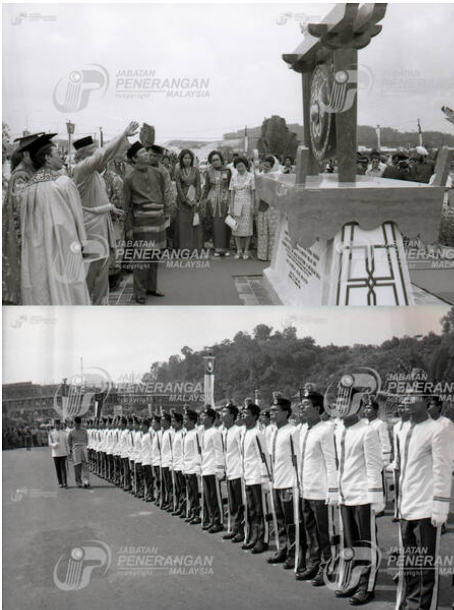
"Majlis Perasmian Kampus Induk Universiti Kebangsaan Malaysia, Bangi, Selangor".