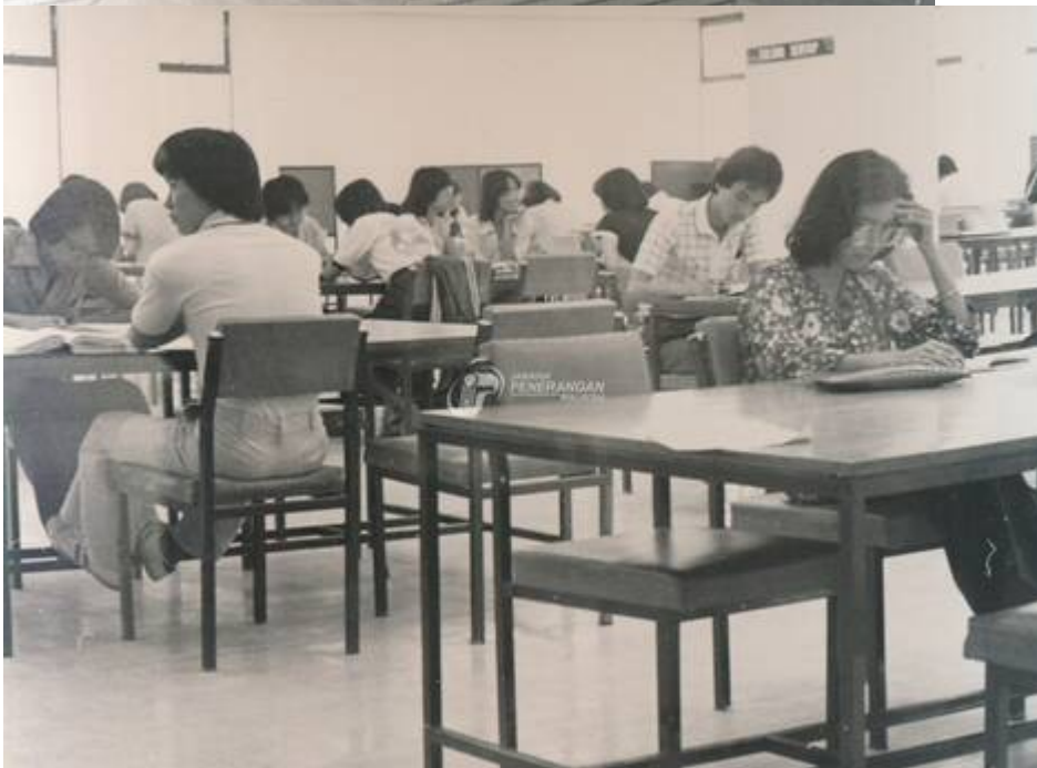
Kiri: "Mahasiswa-mahasiswa memasuki Perpustakaan Tun Sri Lanang, Universiti Kebangsaan Malaysia, Bangi, Selangor. 20.09.1980" (Jabatan Penerangan Malaysia, 1980:

"Perpustakaan Tun Sri Lanang, Universiti Kebangsaan Malaysia, Bangi, Selangor." ).