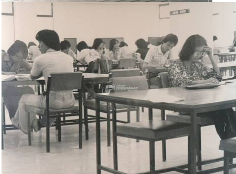
Kiri: "Mahasiswa-mahasiswa memasuki Perpustakaan Tun Sri Lanang, Universiti Kebangsaan Malaysia, Bangi, Selangor. 20.09.1980"

| "Perpustakaan Tun Sri Lanang, Universiti Kebangsaan Malaysia, Bangi, Selangor.").