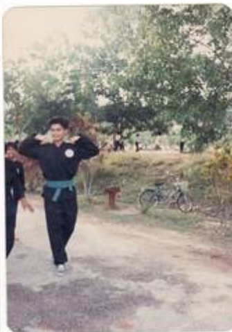
"SRK BBB (Kini SK BBB) 1988"