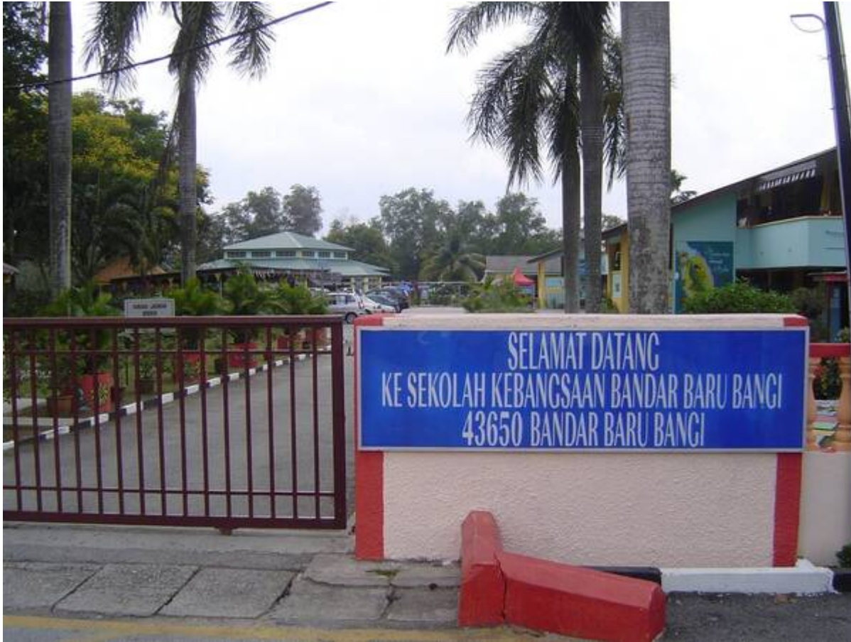
SRK B B Bangi kini (R.Barthy, August 5, 2007: