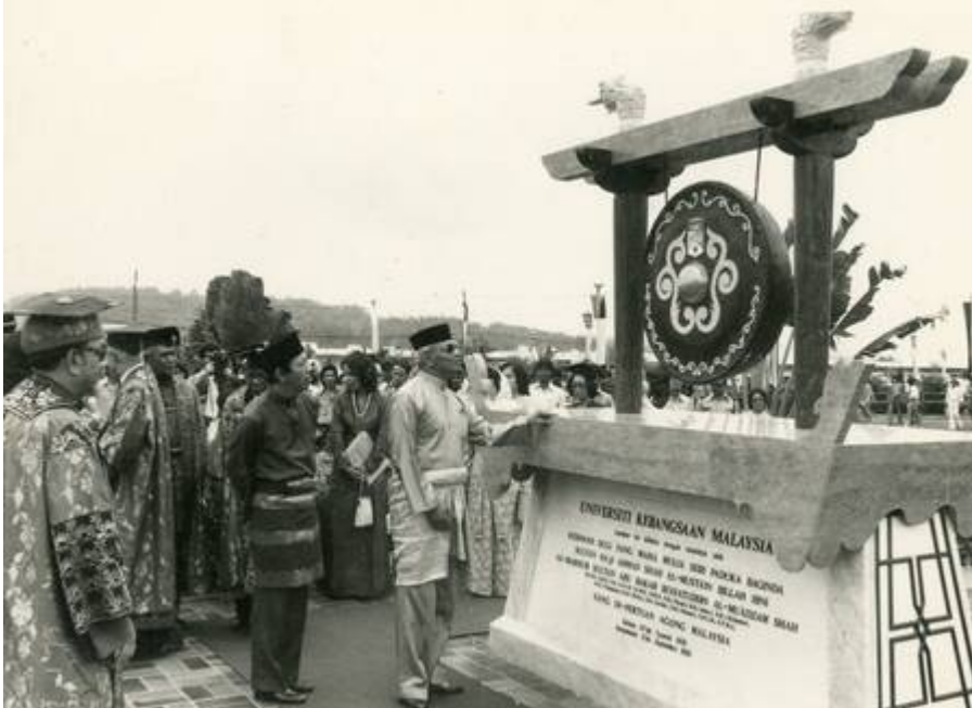
Kelihatan masjid UKM yang masih dalam pembinaan ketika ini. (Rebecca Rajaendram @ The Star, 18 May 2020:

"Universiti Kebangsaan Malaysia: 50 years of inspiring excellence").