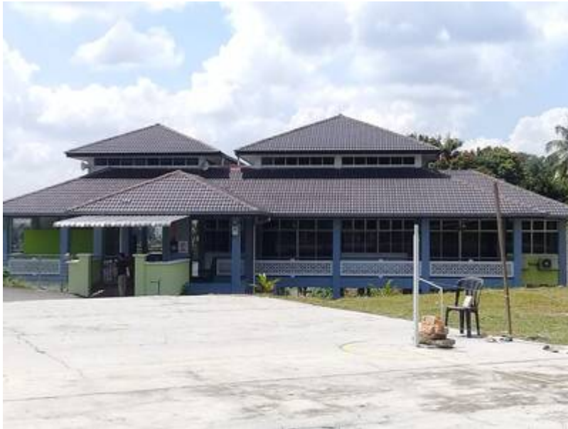
Kiri: Surau lama Kg Bahagia Bangi. Kanan: Surau baru (Al Madrasah Al Hamidiah) (Sumber: Surau Madrasah Al Hamidiah Kg Bahagia Bangi, December 12, 2017:

"Latar Belakang Sejarah Penubuhan Surau Madrasah Al Hamidiah").