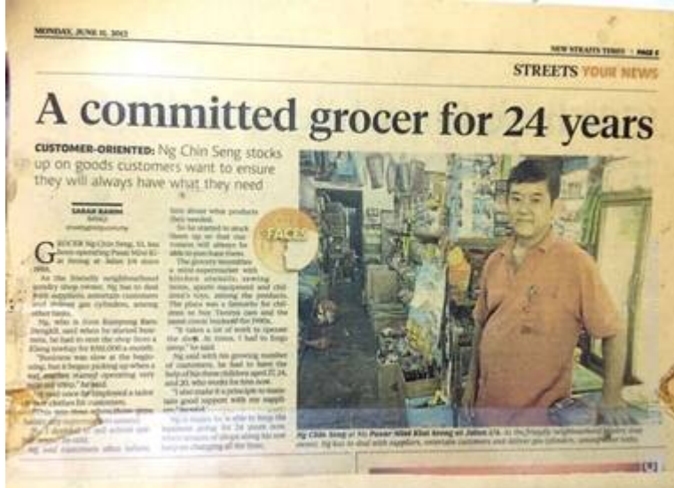
Kiri: Pasar Mini Kiat Seong kini, di lot tepi Jalan 1/4A, Seksyen 1 BBB (Gedung Minda Botak, 4 Ogos, 2021:

"Kedai Runcit Legenda Bangi – Pasar Mini Kiat Siong").