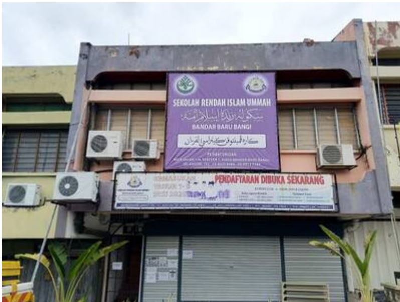
“Pejabat Urusan, No 9 Jalan 1/4, Seksyen 1” (Sekolah Rendah Islam Ummah Bandar Baru Bangi @ Facebook, 14 Januari 2021).