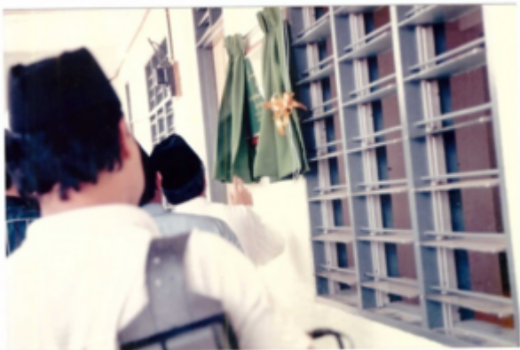
Gambar-gambar di majlis perasmian Surau As-Sobah, pada 11 Mac 1990.