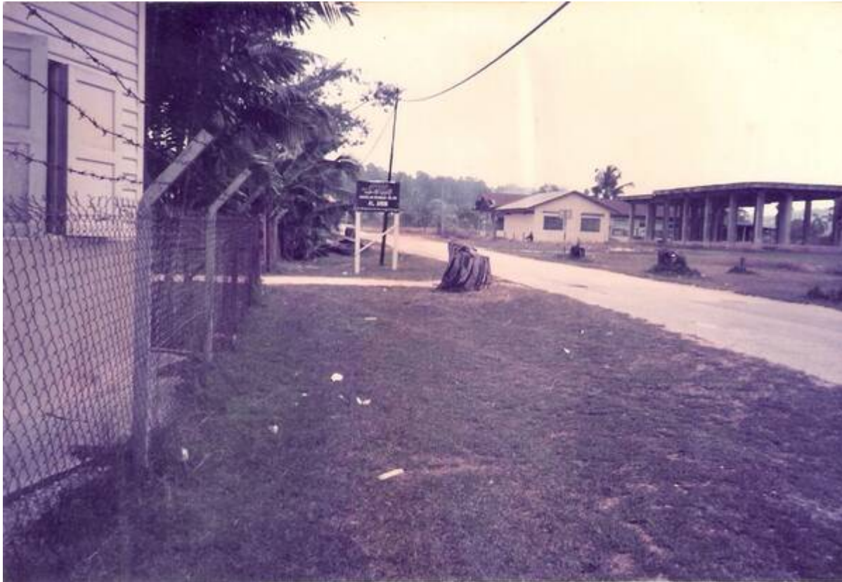
Gambar Sekolah Al-Amin di Masjid Jamek (Lama) Serdang, ketika awal pembukaannya pada tahun 1989 (Former Al-Amin (Serdang & Bangi) Students' Association, May 16, 2009:

"20 tahun di persada pendidikan Islam bersepadu").