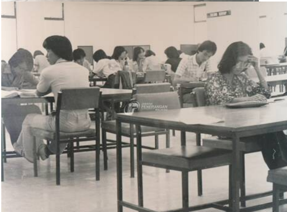
Kiri: "Mahasiswa-mahasiswa memasuki Perpustakaan Tun Sri Lanang, Universiti Kebangsaan Malaysia, Bangi, Selangor. 20.09.1980"

| "Perpustakaan Tun Sri Lanang, Universiti Kebangsaan Malaysia, Bangi, Selangor." ).