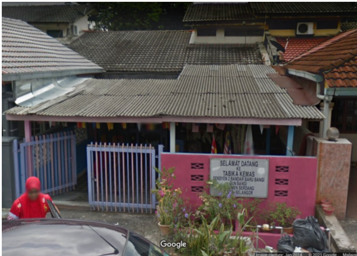
Surau fasa pertama kini adalah Tabika Kemas Seksyen 2, Bandar Baru Bangi. (Sumber: Jabatan Kemajuan Masyarakat: KEMAS, 2021:

| SENARAI ALAMAT TABIKA: SELANGOR , m.s.14. Gambar: Google Maps, 1 Januari 2014 ).