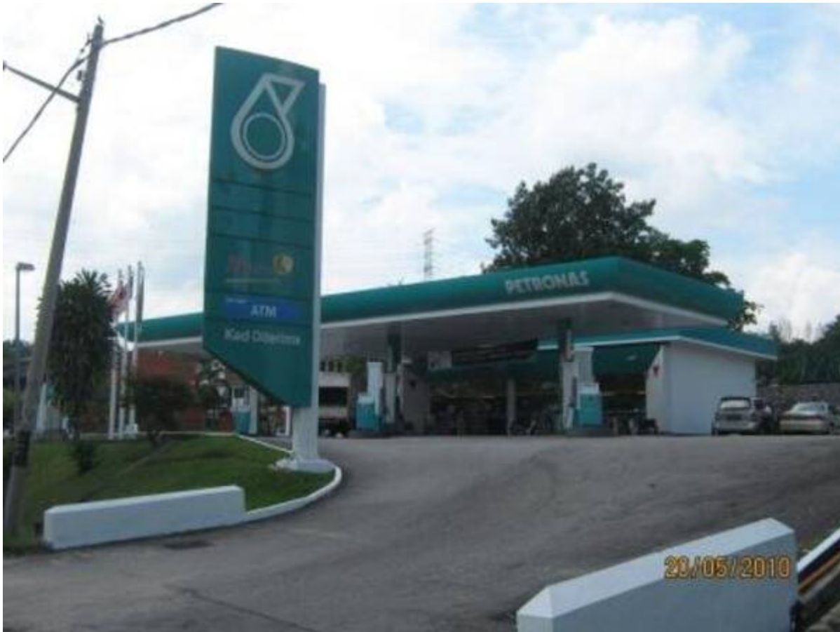
Stesen Petronas UNIKEB (Koperasi UNIKEB Berhad, Universiti Kebangsaan Malaysia, November 1, 2010:

"Sebuah stesyen minyak Petronas di bawah pengurusan UNIKEB telah dibina untuk memberi perkhidmatan kepada penduduk Bandar Baru Bangi. Lokasi stesyen di Jalan 1/1 telah disiapkan pada bulan Mac 1984 dan Stesyen Minyak kedua dibina di Seksyen 4 Bandar Baru Bangi yang beroperasi pada tahun 2001."