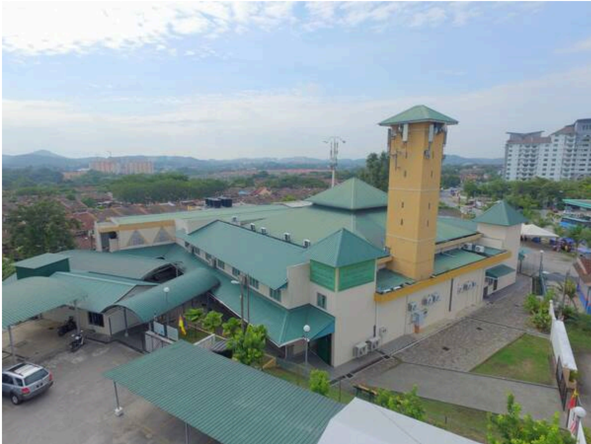
Surau Al Kauthar kini (Facebook:

"Surau Al-Kauthar telah di daftarkan pada 22 Mei, 1987M bersamaan 24 Ramadhan 1407H beralamat di No.71 Jalan 4/6, Fasa 4, BBB (rumah teres). Rujukan Fail JAIS Ruj (2) dlm. JAI. Shah Alam, Selangor. No 7022/61. Memandangkan rumah tersebut agak kecil, maka Jawatankuasa Surau pada masa itu berjaya mendapatkan tapak Bangunan Surau Tetap yang terletak dipersimpangan Jalan 4/1 dan 4/5 Bandar Baru Bangi, Selangor. Dengan adanya sumbangan daripada orang ramai dan Kerajaan Negeri Selangor, dengan kos awal berjumlah RM 81,300.00 maka bangunan surau Al-Kauthar yang baru telah dibina dan mula digunakan pada 01 Februari 1991."