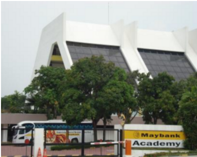
Maybank Training Centre (Najihah Mohd Dlan, Rozilah Kasim, 2012:

1985-09-17: Telah siap dibina, dan tersenarai sebagai antara aset fizikal penting bagi Maybank.