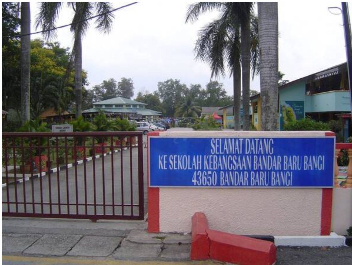
SRK B B Bangi kini (R.Barthy, August 5, 2007: