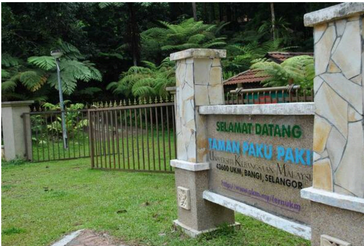
Taman Paku Pakis UKM (Taman Paku Pakis UKM @ Facebook, 12 September 2013).