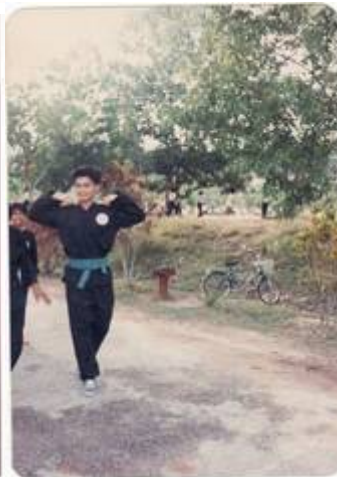
"SRK BBB (Kini SK BBB) 1988"