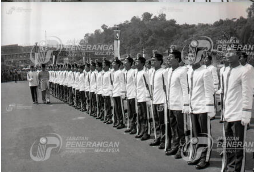
"Majlis Perasmian Kampus Induk Universiti Kebangsaan Malaysia, Bangi, Selangor".