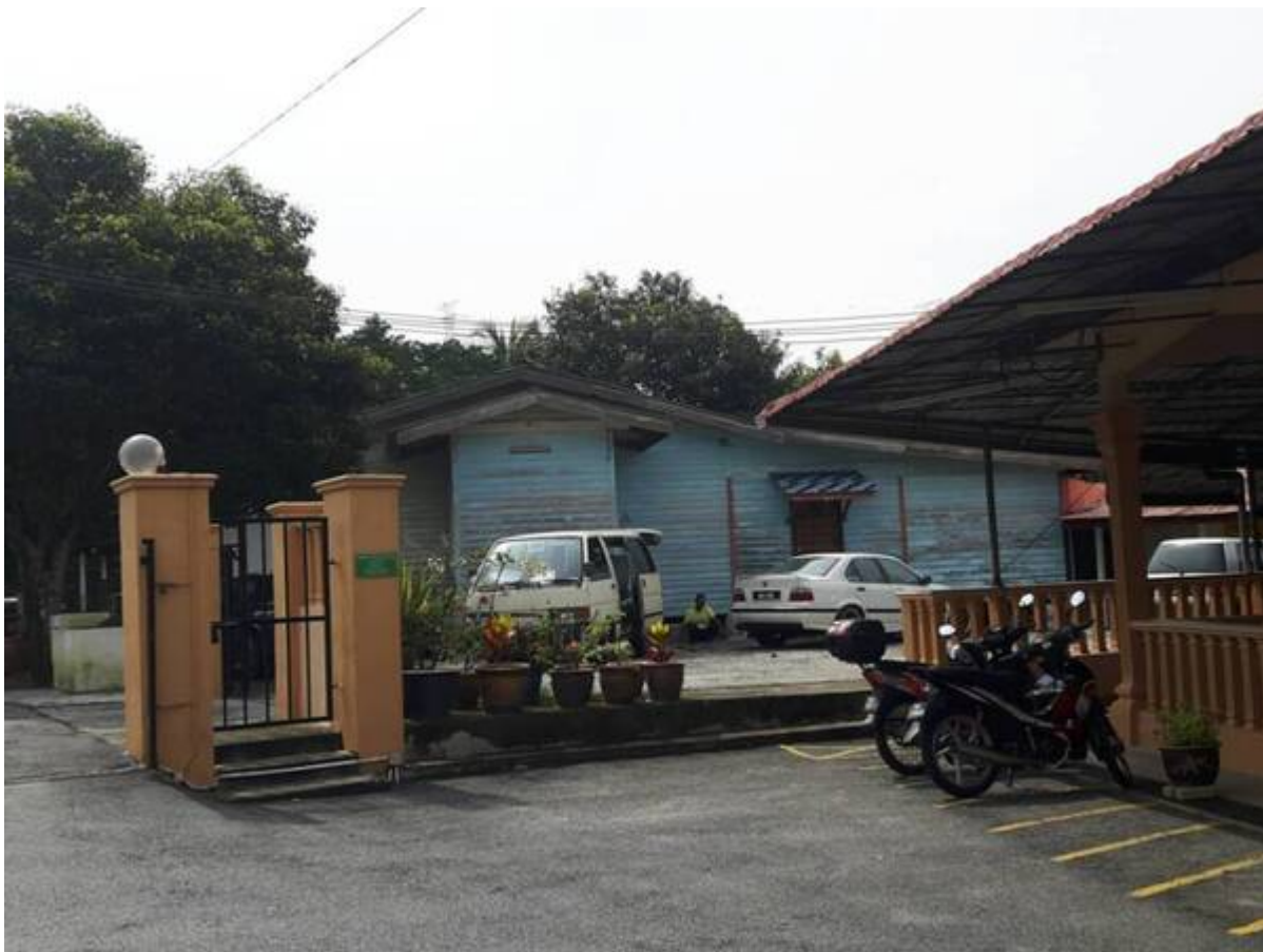
Surau asal yang diperbuat daripada kayu.

Pada tahun 1982, surau pertama telah dibina. Surau yang diperbuat dari kayu ini di bina setelah mendapat peruntukan daripada Kerajaan Negeri Selangor dan diluluskan oleh Ahli Undangan Negeri (ADUN) T.M Thurai (BN- MIC). Beliau merupakan ADUN berbangsa India dan bertanggungjawab ke atas kawasan Dengkil. Pihak surau menyatakan mereka tidak dibenarkan untuk membina surau pada awalnya, tetapi permohonan berjaya apabila pihak surau memohon untuk membina balai dan dibenarkan. Maka terdirilah sebuah surau kayu yang pertama di Bandar Baru Bangi dan surau ini digunakan selama 22 tahun iaitu dari tahun 1982 hingga 2002."