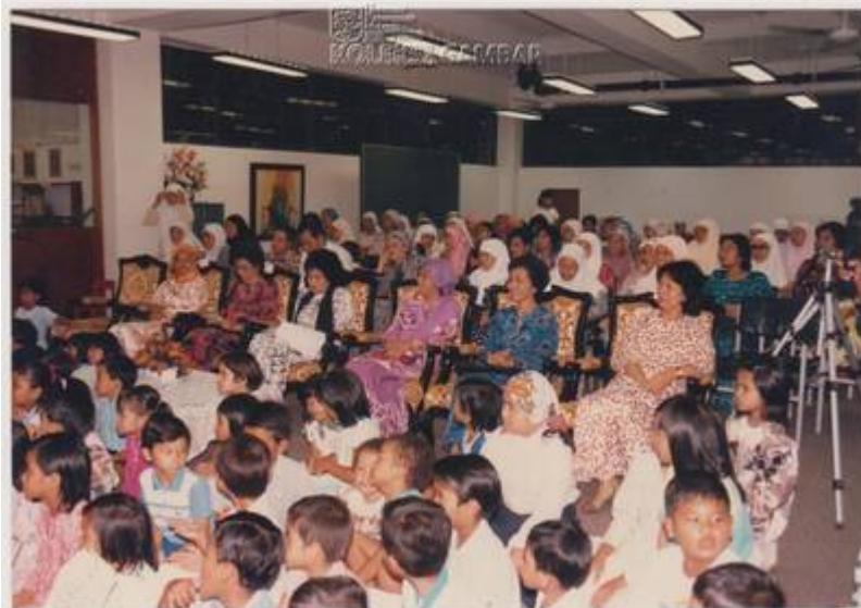
"Sekitar Perasmian Perpustakaan Kanak-Kanak Sukmanita pada 17 September 1988".