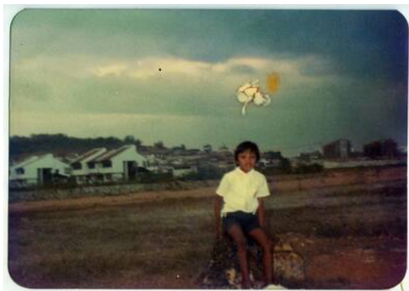
Gambar hiasan: Fasa (Seksyen) 3, B B Bangi, sekitar 1985.