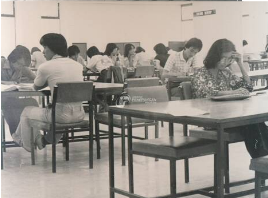
Kiri: "Mahasiswa-mahasiswa memasuki Perpustakaan Tun Sri Lanang, Universiti Kebangsaan Malaysia, Bangi, Selangor. 20.09.1980" (Jabatan Penerangan Malaysia, 1980:

| "Perpustakaan Tun Sri Lanang, Universiti Kebangsaan Malaysia, Bangi, Selangor." ).