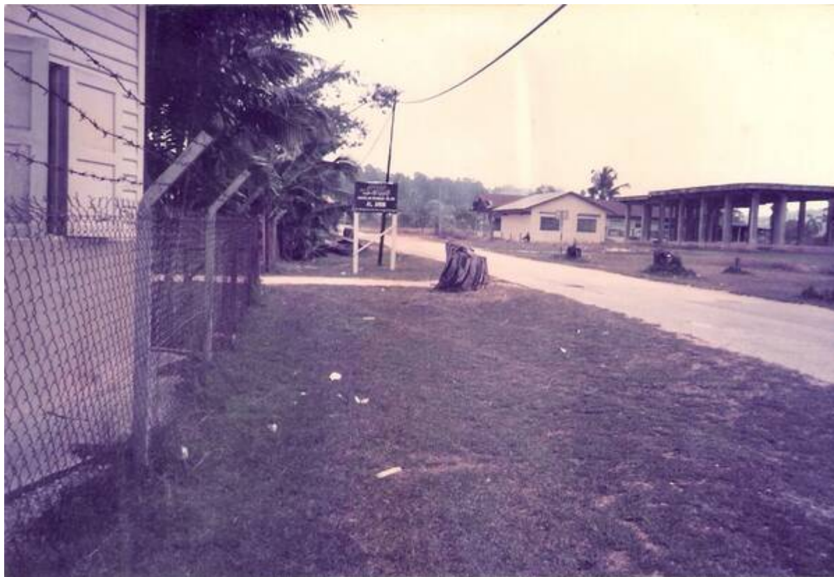
Gambar Sekolah Al-Amin di Masjid Jamek (Lama) Serdang, ketika awal pembukaannya pada tahun 1989 (Former Al-Amin (Serdang & Bangi) Students' Association, May 16, 2009:

"20 tahun di persada pendidikan Islam bersepadu").