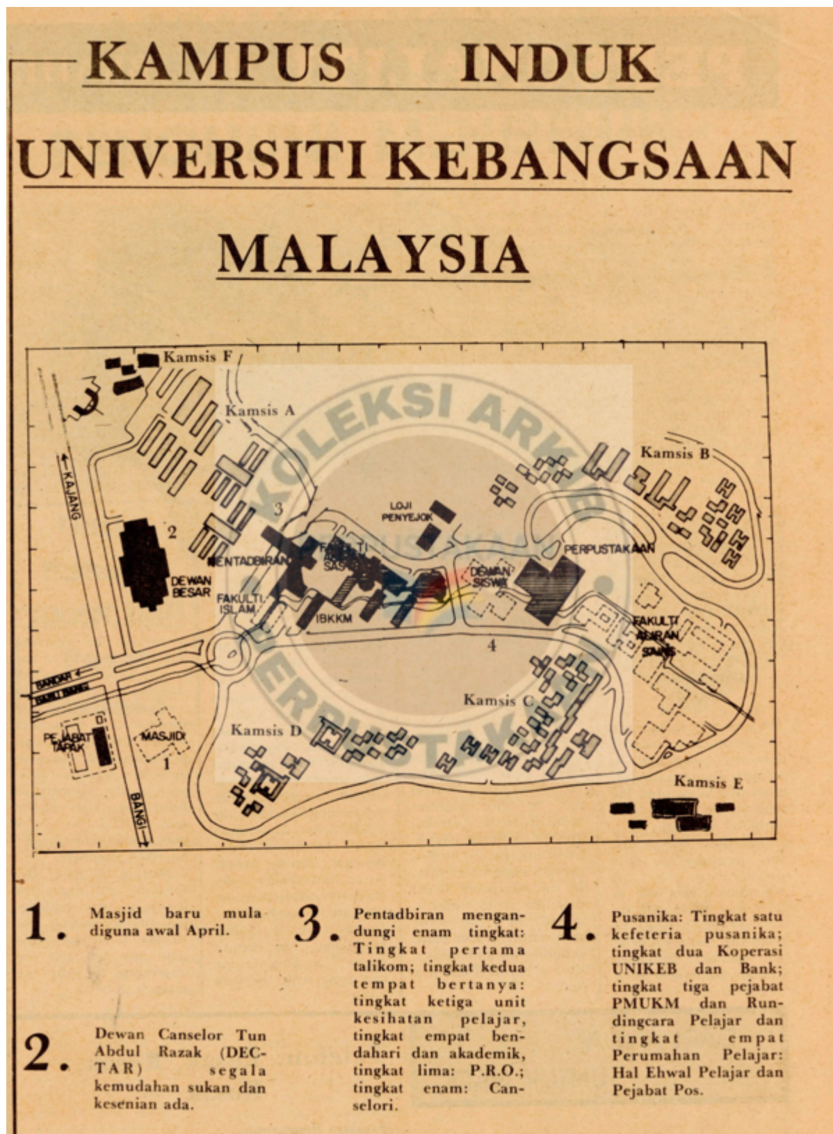
Peta kampus induk UKM, 1982 (Makmal Jabatan Komunikasi, UKM: Nadi Bangi Mei 1982:

"Universiti Kebangsaan Malaysia: 50 years of inspiring excellence").