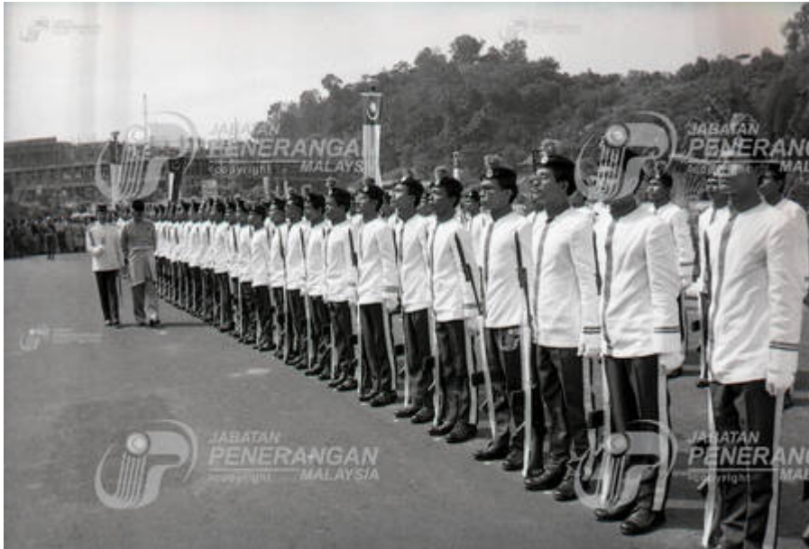
"Majlis Perasmian Kampus Induk

Universiti Kebangsaan Malaysia, Bangi, Selangor".