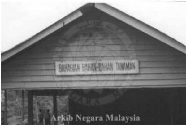
Kiri: "BANGUNAN BAHAGIAN BAHAN-BAHAN TANAMAN. LADANG PRANG BESAR KAJANG, SELANGOR. 15/11/1994" (Arkib Negara, 15/11/1994: