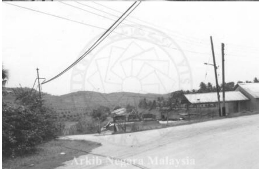
Kiri: "PANDANGAN LADANG GETAH, PRANG BESAR, KAJANG ,SELANGOR. 15/11/1994" (Arkib Negara, 15/11/1994: