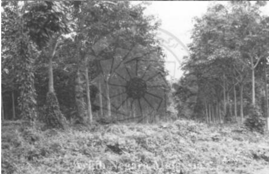
Kiri: "PEMANDANGAN LADANG PRANG BESAR (GOLDEN HOPE), 43000 KAJANG, SELANGOR, 15/11/1994" (Arkib Negara, 15/11/1994: