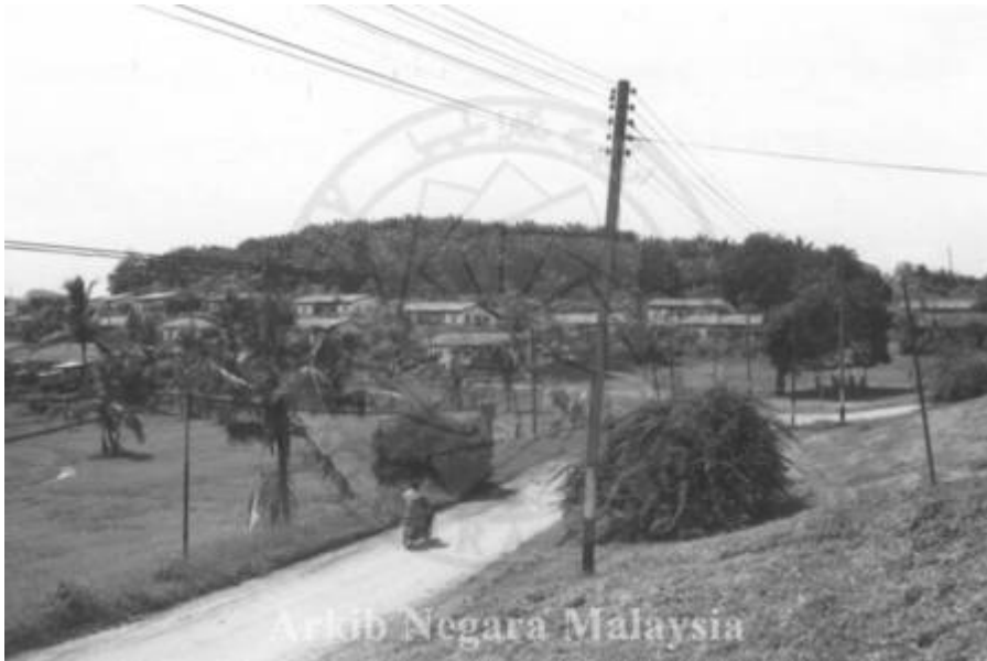
"PANDANGAN MENUNJUKAN KAWASAN PERUMAHAN LADANG PRANG BESAR (GOLDEN HOPE), 43000 KAJANG, SELANGOR, 15/11/1994" (Arkib Negara 2000/0014803W, 15/11/1994:

| "PANDANGAN MENUNJUKAN KAWASAN PERUMAHAN LADANG PRANG BESAR (GOLDEN HOPE), 43000 KAJANG, SELANGOR, 15/11/1994").