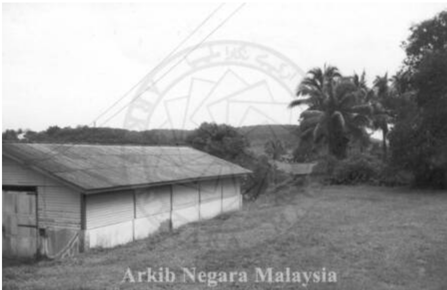
"GUDANG LADANG PRANG BESAR, 43000 KAJANG, SELANGOR. 15/11/1994" (Arkib Negara 2000/0011613W, 15/11/1994:

| "TEMPAT LETAK KERETA & KILANG GETAH, LADANG PRANG BESAR, 43000 KAJANG, SELANGOR").