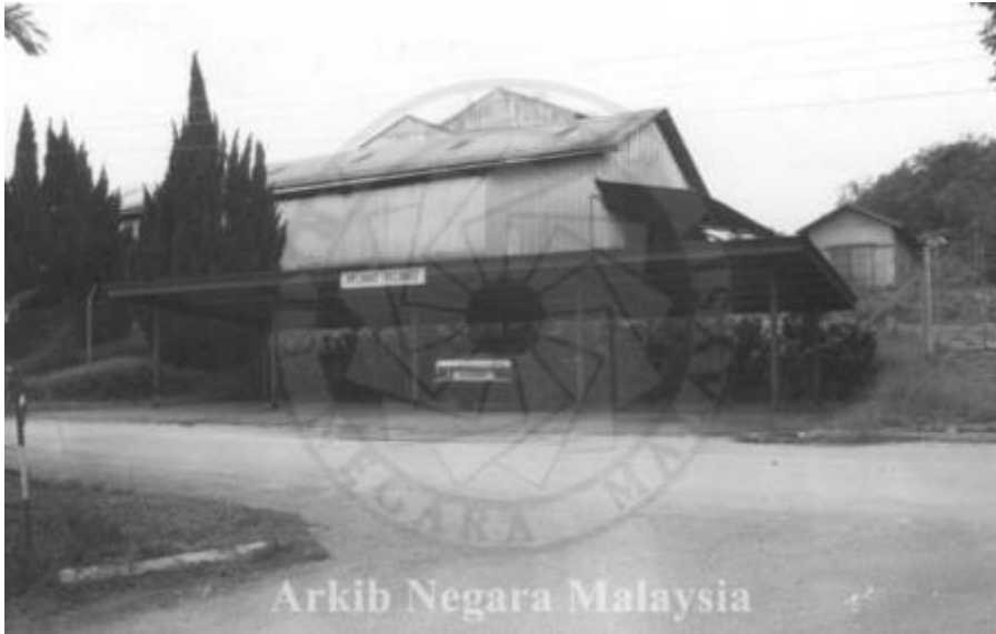
Kiri: "KILANG GETAH, LADANG PRANG BESAR KAJANG, SELANGOR. 15/11/1994" (Arkib Negara 2000/0011620W, 15/11/1994:

| "KILANG GETAH, LADANG PRANG BESAR KAJANG, SELANGOR. 15/11/1994").