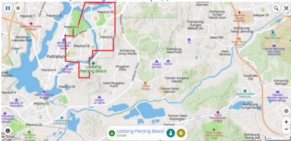
Kawasan Ladang Prang Besar (kini Putrajaya), di sebelah kiri. Hutan Simpan Bangi (kini UKM), di sebelah kanan (Mapcarta).

"1929 F.M.S. Wall Map of Selangor (Kuala Lumpur)".