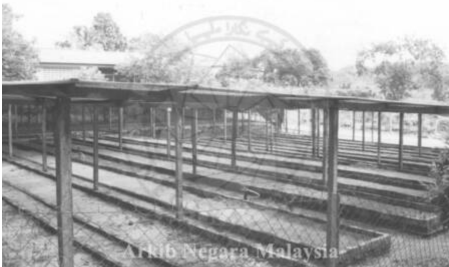
Kiri: "PANDANGAN LADANG GETAH, PRANG BESAR, KAJANG ,SELANGOR. 15/11/1994" (Arkib Negara 2000/0011624W, 15/11/1994:

| "PANDANGAN LADANG GETAH, PRANG BESAR, KAJANG ,SELANGOR. 15/11/1994").