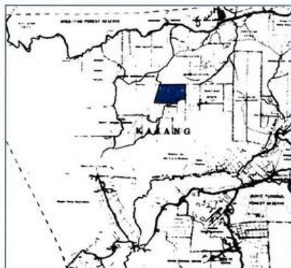
Peta Daerah Ulu Langat yang dikeluarkan oleh Jabatan Ukur pada tahun 1925 menunjukkan kawasan Estate Prang Besar

Di bawah skim ini, setiap bekas tentera British yang hendak mengemukakan permohonan mereka mestilah seorang rakyat British atau rakyat di empat buah negeri dalam Negeri-Negeri Melayu Bersatu; pernah menyertai peperangan sebagai seorang tentera British; mempunyai pekerjaan yang tetap di Negeri-Negeri Melayu Bersatu semasa peperangan meletus dan juga semasa permohonan dikemukakan. Sekiranya permohonan tersebut berjaya, mereka akan diberi 100 ekar tanah seorang. Pemberian tanah hanya akan dihadkan di tiga buah negeri di barat Tanah Melayu dan tanah-tanah tersebut perlu diserahkan untuk