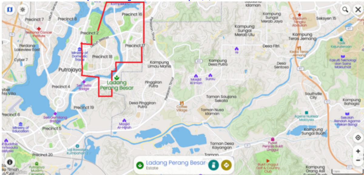
Kawasan Ladang Prang Besar (kini Putrajaya), di sebelah kiri. Hutan Simpan Bangi (kini UKM), di sebelah kanan (Mapcarta).

"1929 F.M.S. Wall Map of Selangor (Kuala Lumpur)".