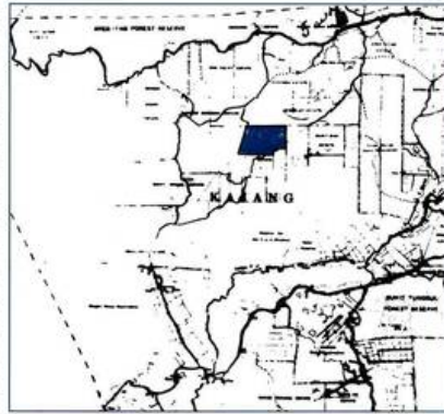
Peta Daerah Ulu Langat yang dikeluarkan oleh Jabatan Ukur pada tahun 1925 menunjukkan kawasan Estate Prang Besar

Di bawah skim ini, setiap bekas tentera British yang hendak mengemukakan permohonan mereka mestilah seorang rakyat British atau rakyat di empat buah negeri dalam Negeri-Negeri Melayu Bersatu; pernah menyertai peperangan sebagai seorang tentera British; mempunyai pekerjaan yang tetap di Negeri-Negeri Melayu Bersatu semasa peperangan meletus dan juga semasa permohonan dikemukakan. Sekiranya permohonan tersebut berjaya, mereka akan diberi 100 ekar tanah seorang. Pemberian tanah hanya akan dihadkan di tiga buah negeri di barat Tanah Melayu dan tanah-tanah tersebut perlu diserahkan untuk