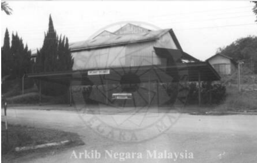
Kiri: "KILANG GETAH, LADANG PRANG BESAR KAJANG, SELANGOR. 15/11/1994" (Arkib Negara 2000/0011620W, 15/11/1994:

| "KILANG GETAH, LADANG PRANG BESAR KAJANG, SELANGOR. 15/11/1994").