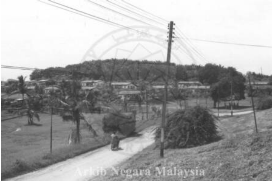
Kiri: "PANDANGAN LADANG GETAH, PRANG BESAR, KAJANG ,SELANGOR. 15/11/1994" (Arkib Negara 2000/0011624W, 15/11/1994:

| "PANDANGAN LADANG GETAH, PRANG BESAR, KAJANG ,SELANGOR. 15/11/1994").