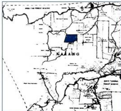
Peta Daerah Ulu Langat yang dikeluarkan oleh Jabatan Ukur pada tahun 1925 menunjukkan kawasan Estate Prang Besar

Di bawah skim ini, setiap bekas tentera British yang hendak mengemukakan permohonan mereka mestilah seorang rakyat British atau rakyat di empat buah negeri dalam Negeri-Negeri Melayu Bersatu; pernah menyertai peperangan sebagai seorang tentera British; mempunyai pekerjaan yang tetap di Negeri-Negeri Melayu Bersatu semasa peperangan meletus dan juga semasa permohonan dikemukakan. Sekiranya permohonan tersebut berjaya, mereka akan diberi 100 ekar tanah seorang. Pemberian tanah hanya akan dihadkan di tiga buah negeri di barat Tanah Melayu dan tanah-tanah tersebut perlu diserahkan untuk