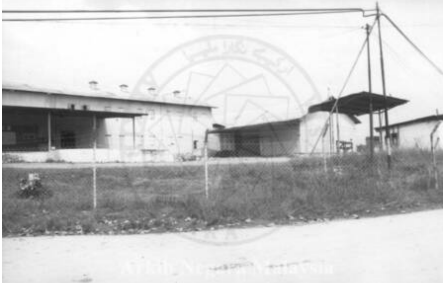
Kiri: "PANDANGAN LADANG GETAH, PRANG BESAR, KAJANG ,SELANGOR. 15/11/1994" (Arkib Negara 2000/0011624W, 15/11/1994:

| "PANDANGAN LADANG GETAH, PRANG BESAR, KAJANG ,SELANGOR. 15/11/1994").