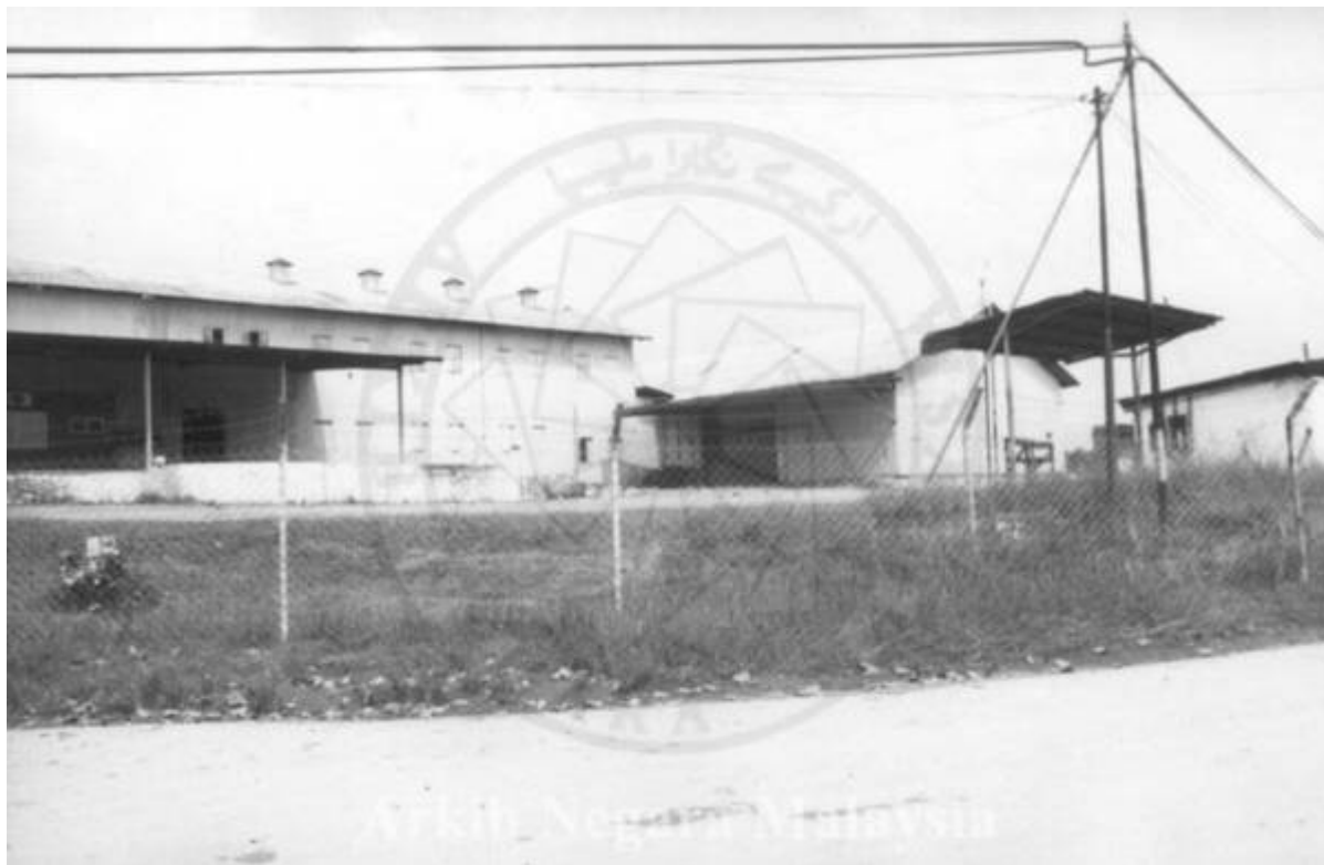
"KILANG GETAH, LADANG PRANG BESAR KAJANG, SELANGOR. 15/11/1994" (Arkib Negara 2000/0011620W, 15/11/1994:

"KILANG GETAH, LADANG PRANG BESAR KAJANG, SELANGOR. 15/11/1994").