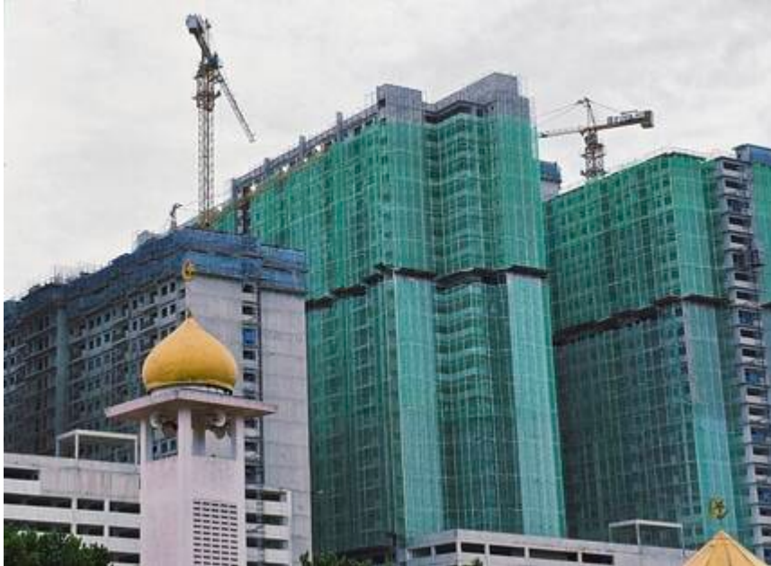
"Dulu & Sekarang. Menara Masjid Bangi" (Faizal Zainal @ Facebook Pekan Bangi, 29 Disember 2025: "Dulu & Sekarang").