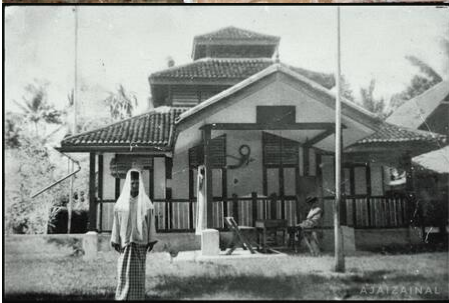
"Masjid Bangi sekitar pertengahan 1950-an" (Kiri: Gambar asal: Faizal Hj Zainal , September 14, 2008:

| "Sejarah Bangi"); Kanan: Gambar diperbaiki: Faizal Zainal @ Facebook Pekan Bangi , 9 September 2025: "Masjid Pertama di Bangi").