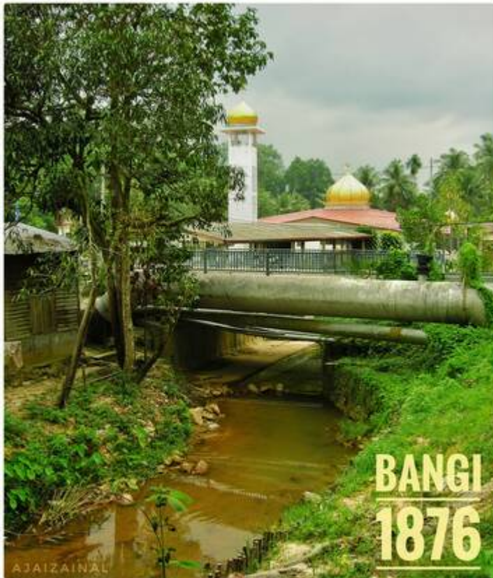
Masjid Kariah Bangi kini. (Kiri: Faizal Hj Zainal , September 14, 2008: