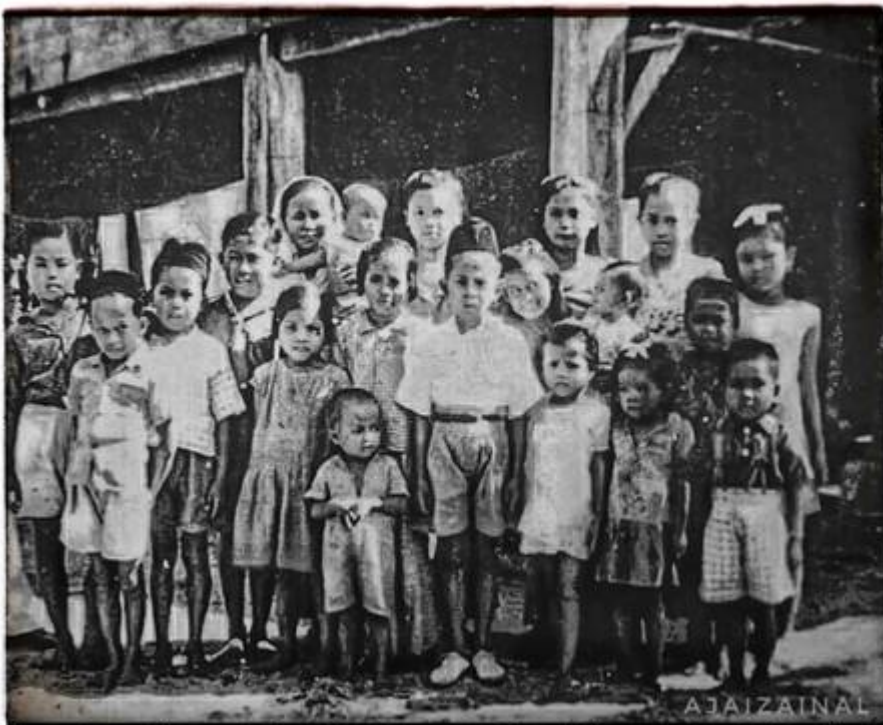
Kiri: "Kanak -Kanak Bangi -sekitar 1948" (Faizal Hj Zainal, September 14, 2008: