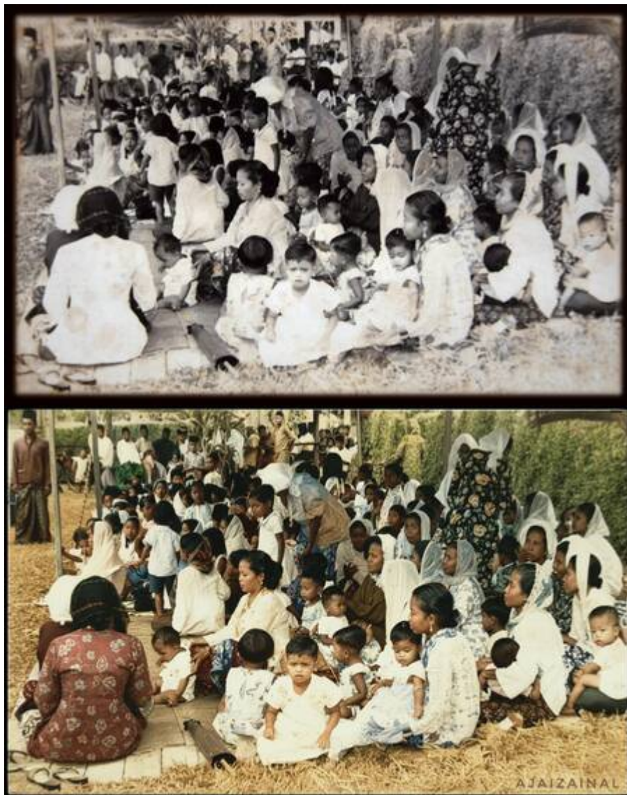
"Maulud Nabi Di Bangi 1957" (Kiri: Gambar asal. Kanan: Gambar diperbaiki).