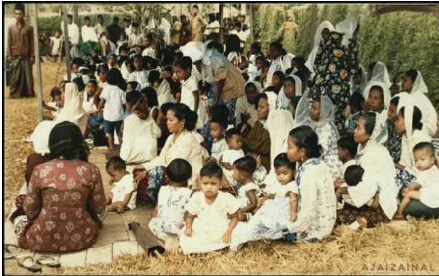
"Maulud Nabi Di Bangi 1957" (Kiri: Gambar asal. Kanan: Gambar diperbaiki).