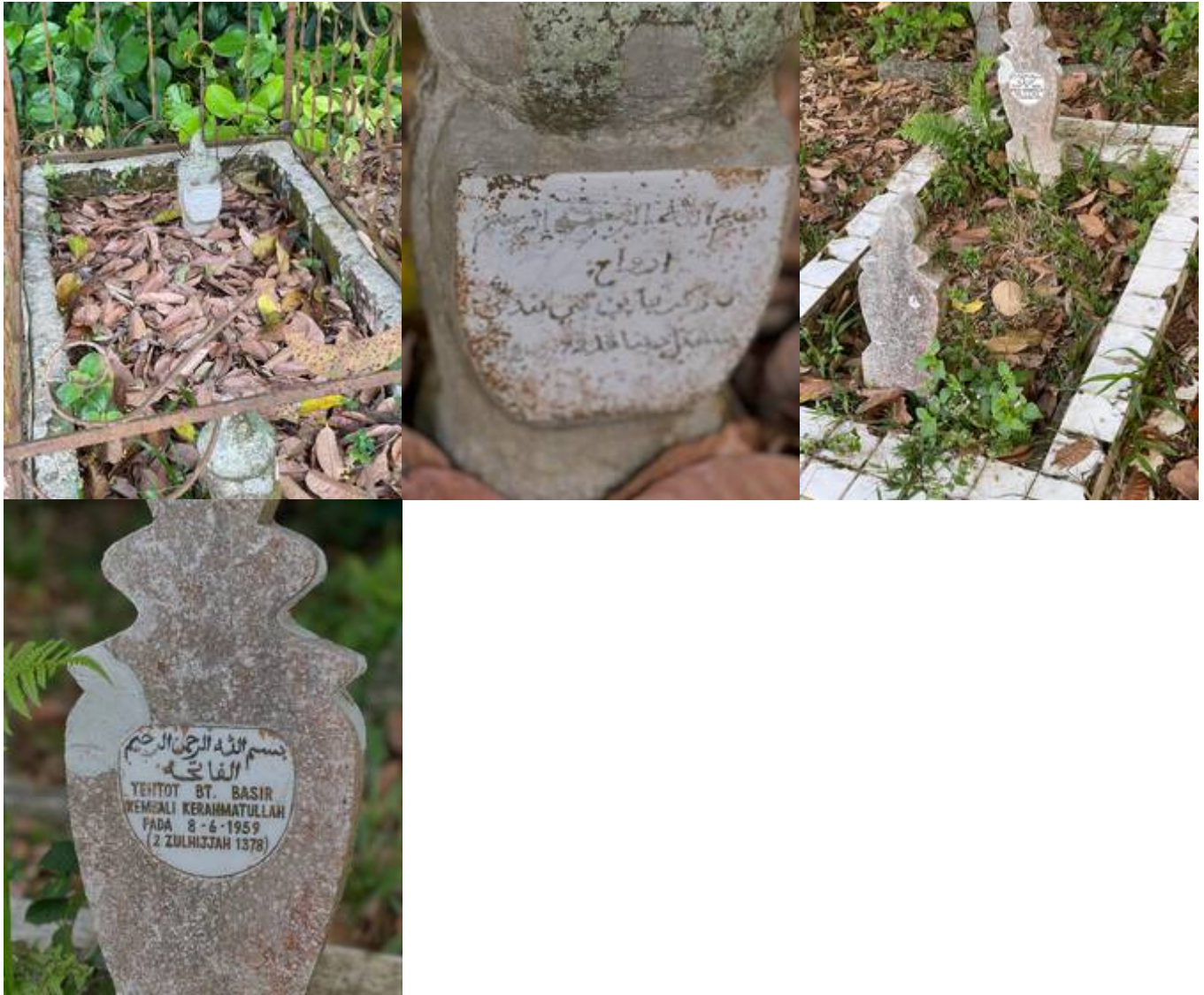
“Kelmarin min berkesempatan menziarahi pusara moyang min di Tanah Perkuburan Kg. Sungai Buah.. Inilah pusara Allahyarham Lebai Zakaria bin Lebai Tandan, pengasas Masjid Kariah Pekan Bangi & Isteri Allahyarhamah Teh Tot binti Basir. Al-Fatihah” (Facebook Pekan Bangi, 2 April 2025: "...pusara Allahyarham Lebai Zakaria bin Lebai Tandan").

From: https://bangi.pulasan.my/ - Cebisan Sejarah Bangi