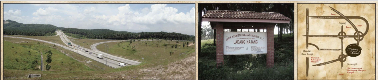
Kawasan Ladang Kajang yang bakal dibangunkan.