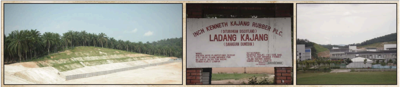
Kawasan Ladang Dunedin , Bangi yang bakal dibangunkan.