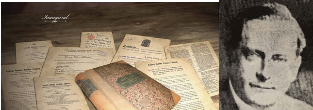
Kiri: Dokumen-dokumen Ladang Kajang . Kanan: R.C.M. Kindersley. ( Inch Kenneth Rubber Estates Limited , 2010: