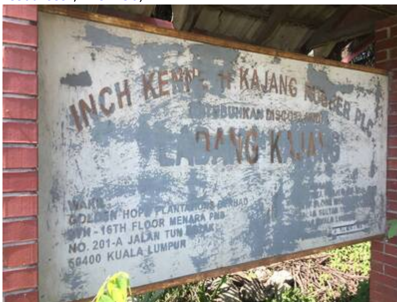
Papan tanda Ladang Inch Kenneth , Kajang (Eric Lim @ Museum Volunteers, JMM, July 15, 2020:

" Twentieth century impressions of British Malaya: its history, people, commerce, industries, and resources ", m.s. 456).