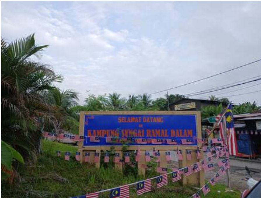
Gerbang Kampung Sungai Ramal Dalam, Simpang Jalan Dusun-Dato Dagang, September 2024.