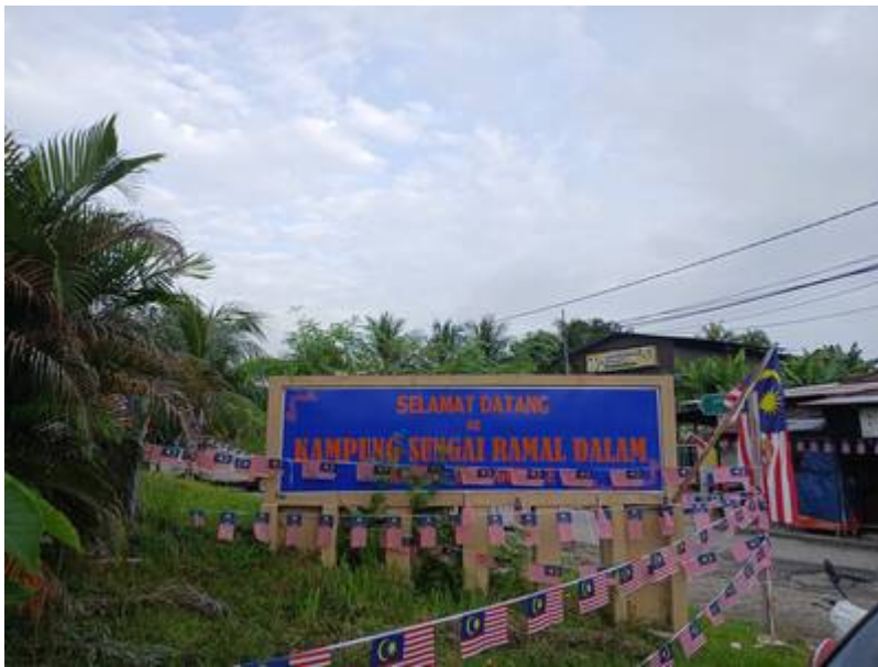
Gerbang Kampung Sungai Ramal Dalam, Simpang Jalan Dusun-Dato Dagang, September 2024.