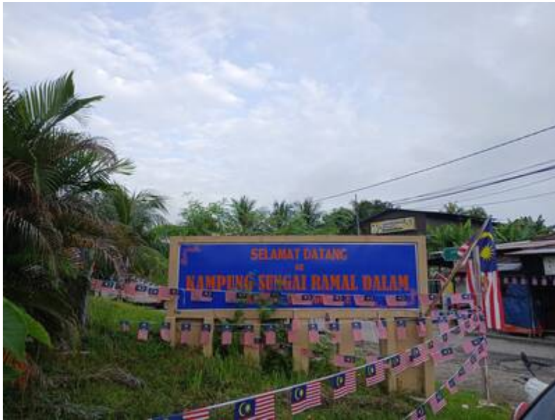
Gerbang Kampung Sungai Ramal Dalam, Simpang Jalan Dusun-Dato Dagang, September 2024.