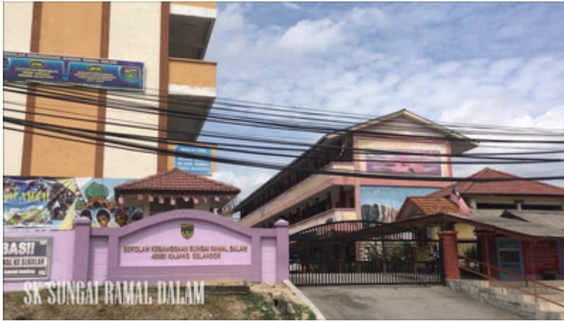
SK Sungai Ramal Dalam, kini (Kampung Sungai Ramal Dalam @ Youtube, 1 Jan 2017: " PROJEK LAMAN SESAWANG KG. SG. RAMAL DALAM, KAJANG ").