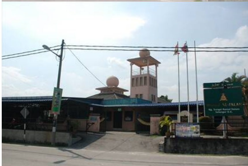
Kiri: Masjid Al-Falah, 2010. (Jabatan Agama Islam Selangor, 2010: " MASJID AL-FALAH SG. RAMAL DALAM ").