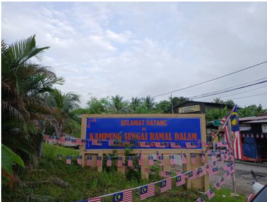
Gerbang Kampung Sungai Ramal Dalam, Simpang Jalan Dusun-Dato Dagang, September 2024.