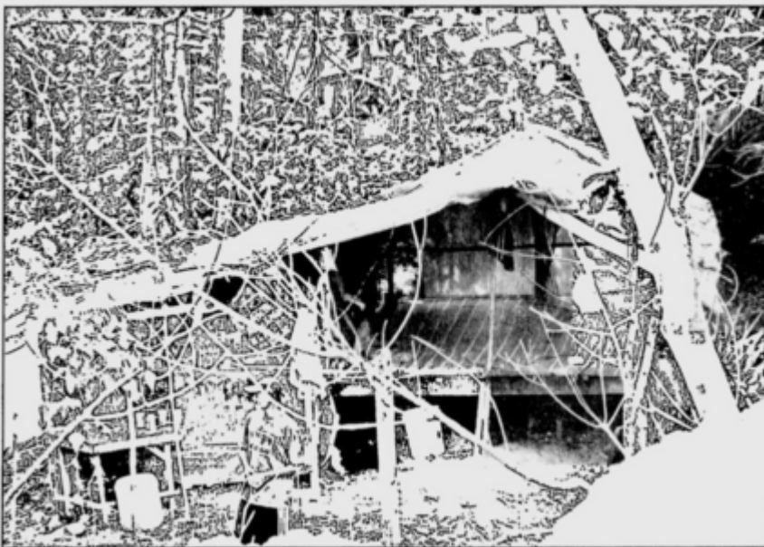
EVIDENCE ... Some of the make-shift houses constructed of pieces of wood and canvas.

Perkampungan warga asing di Kampung Limau Nipis (New Straits Times, 12 Feb 2000: