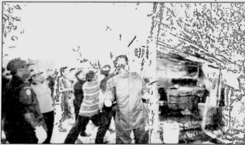
END OF THE ROAD ... Enforcement officers tearing down one of the 180 makeshift shelters