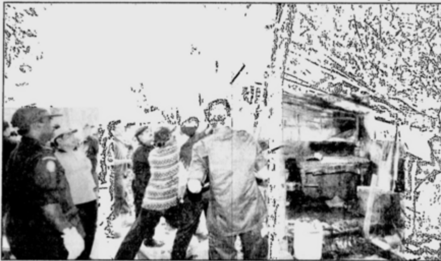
END OF THE ROAD ... Enforcement officers tearing down one of the 180 makeshift shelters