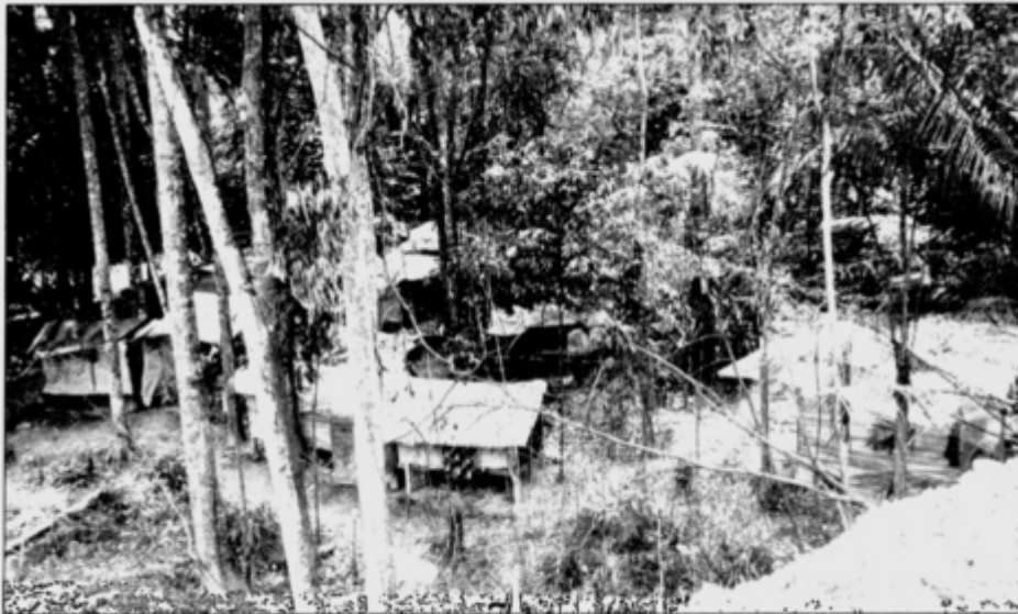
CAUSE FOR WORRY ... These make-shift shelters, erected by Indonesian illegal immigrants at Kampung Limau Manis in Sungai Merap, are giving villagers sleepless nights. Residents see the 'invasion' by the immigrants as a threat to their safety and hygiene.