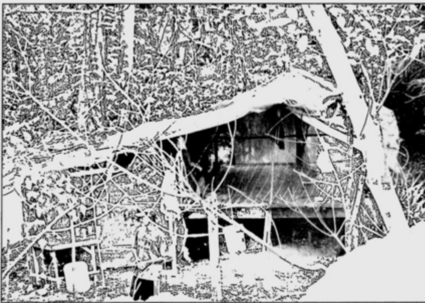
EVIDENCE ... Some of the make-shift houses constructed of pieces of wood and canvas.

Perkampungan warga asing di Kampung Limau Nipis (New Straits Times, 12 Feb 2000: