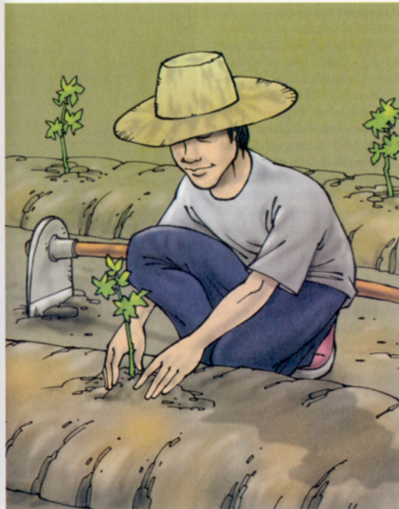
Pada masa lalu, pokok yang dinamakan limau manis ditanam dengan meluas oleh petani di Kampung Limau Manis.

yang berbuah dan sangat manis rasanya. Rupa buah itu seperti Limau tetapi rasa manisnya berbeza dengan rasa jenis-jenis Limau yang lain yang kebiasaannya masam. Kemudiannya, mereka telah memperkembangkan tanaman tersebut dengan menanamnya di celah-celah tanaman pokok Pinang dan Belinjau. Akhirnya tanaman ini telah berkembang di kawasan mereka dan ramai orang mengenalinya sebagai Limau Manis. Oleh itu nama kampung ini telah digelar sebagai Kampung Limau Manis."