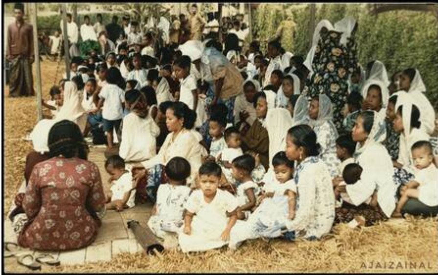
"Maulud Nabi Di Bangi 1957" ( Kiri: Gambar asal. Kanan: Gambar diperbaiki).