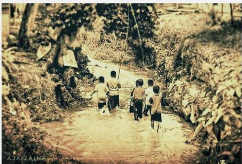
Kiri: Anak-anak menjelajah Sungai Bangi (Faizal Hj Zainal, September 14, 2008: