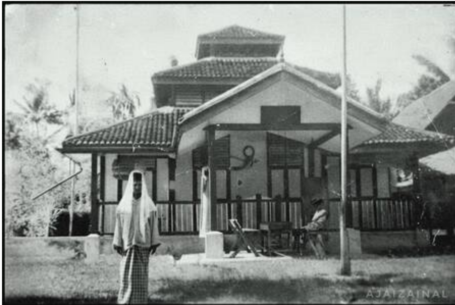
"Foto lama yang telah diperbaiki ini memaparkan wajah lebih jelas Masjid Bangi pada sekitar pertengahan 1950an." (Kiri: Gambar asal: Faizal Hj Zainal , September 14, 2008:

"Sejarah Bangi"); Kanan: Gambar diperbaiki: Faizal Zainal @ Facebook Pekan Bangi, 9 September 2025: "Masjid Pertama di Bangi").