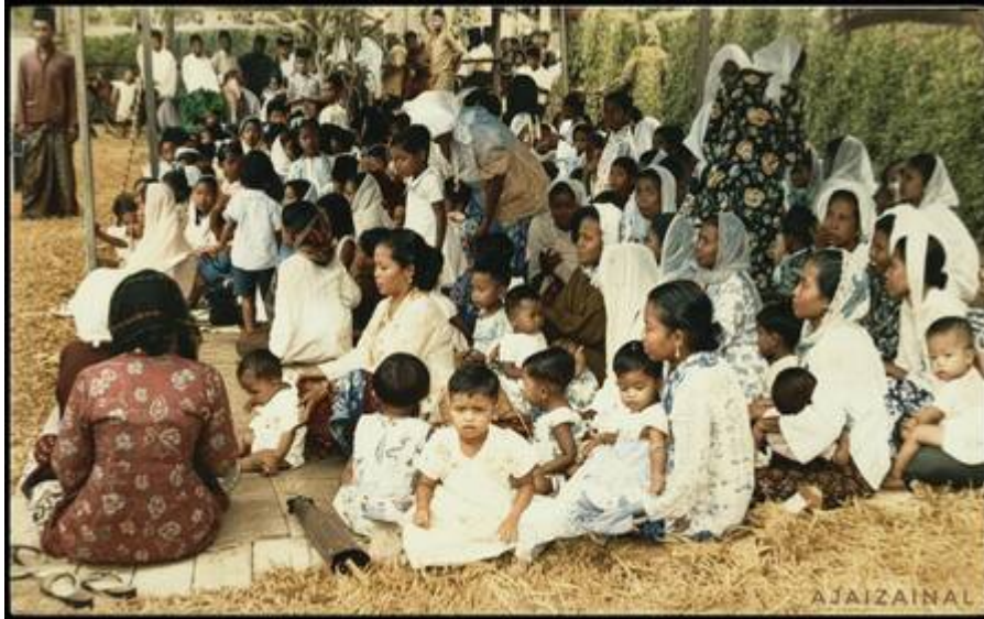
"Maulud Nabi Di Bangi 1957" ( Kiri: Gambar asal. Kanan: Gambar diperbaiki).