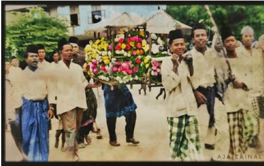
"Maulud Nabi Di Bangi 1957"

(Kiri: Gambar asal. Kanan: Gambar diperbaiki).