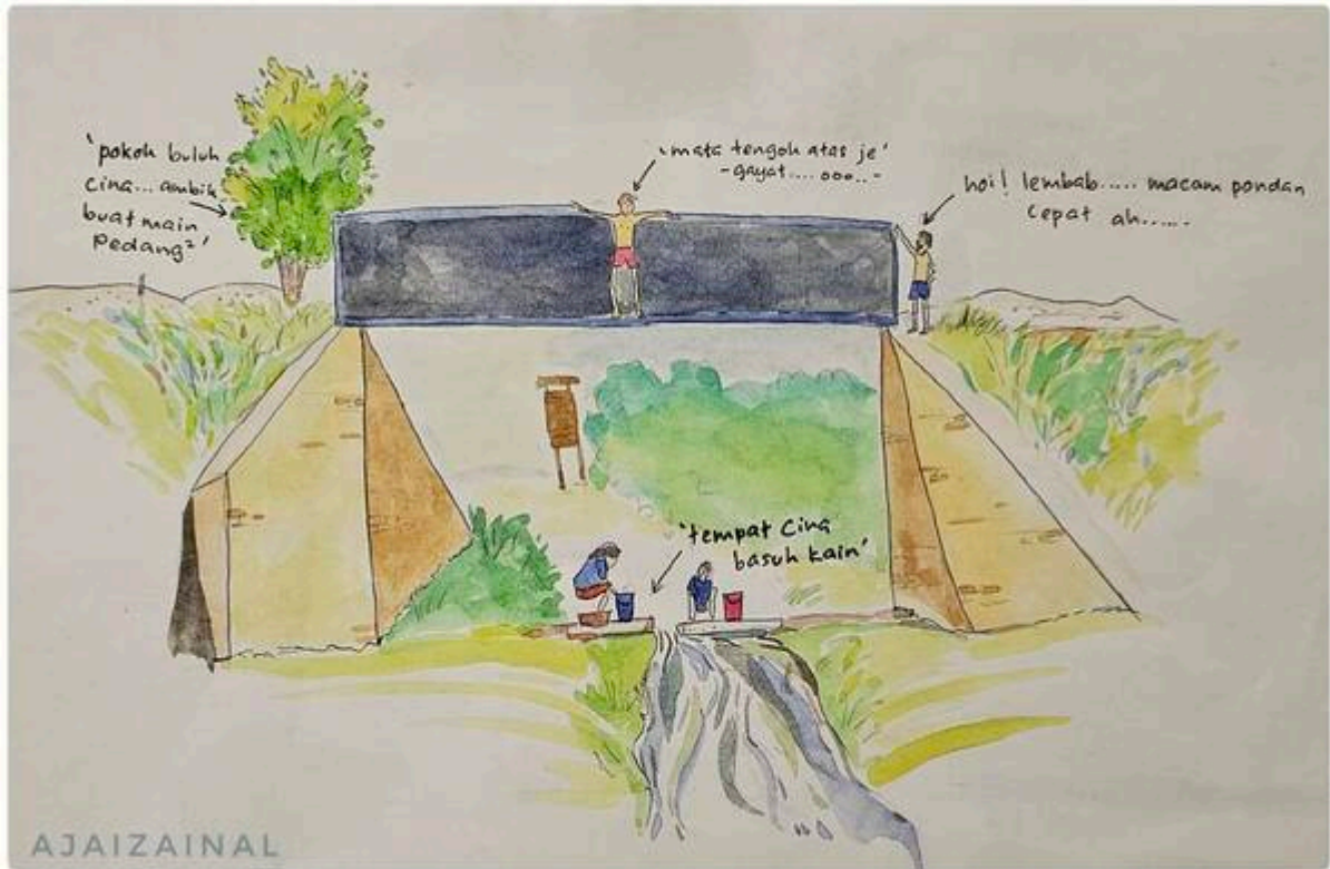
“Jambatan Hitam Sungai Bangi”

“Masa kecil - kecil dulu kitaorang akan buat ujian keberanian menyeberang jambatan dari sisi jambatan keretapi ni dan jugak kena terjun ke bawah untuk buktikan kita ni bukan pondan. Kalau dulu - dulu dipanggil pondan memang malu betul...jadi memang semua sanggup terjun ke sungai walaupun banyak batu asalkan tak menanggung sakit hati dan malu dipanggil pondan. ilustrasi kartun - ajaizainal 1998”